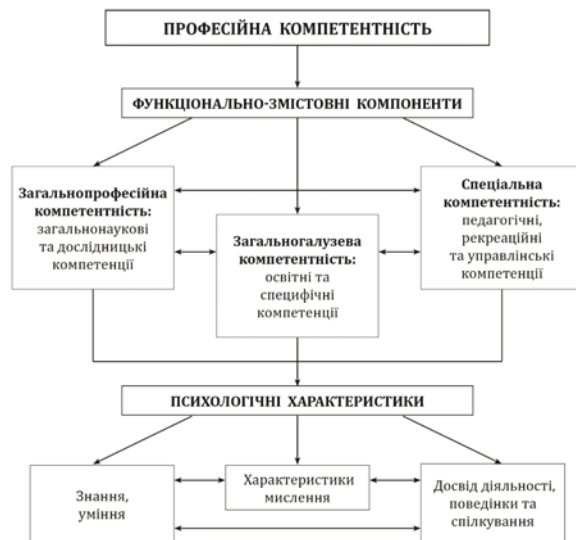
Рис. 1. Структурна модель професійної компетентності фахівця

Структурна модель професійної компетентності фахівця, що описана С.О. Хазовою, наведена на рис. 1.