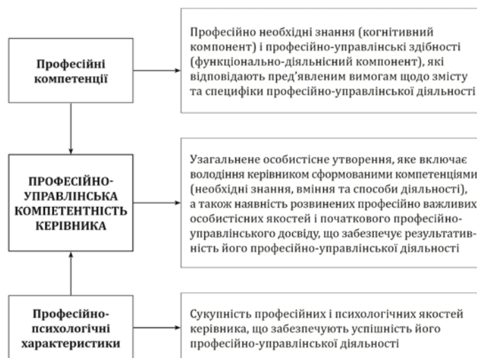
Рис. 3. Базові складові структури професійно-управлінської компетентності керівника

Базові складові структури професійної управлінської компетентності керівника поліцейського підрозділу зображені на рис. 3.