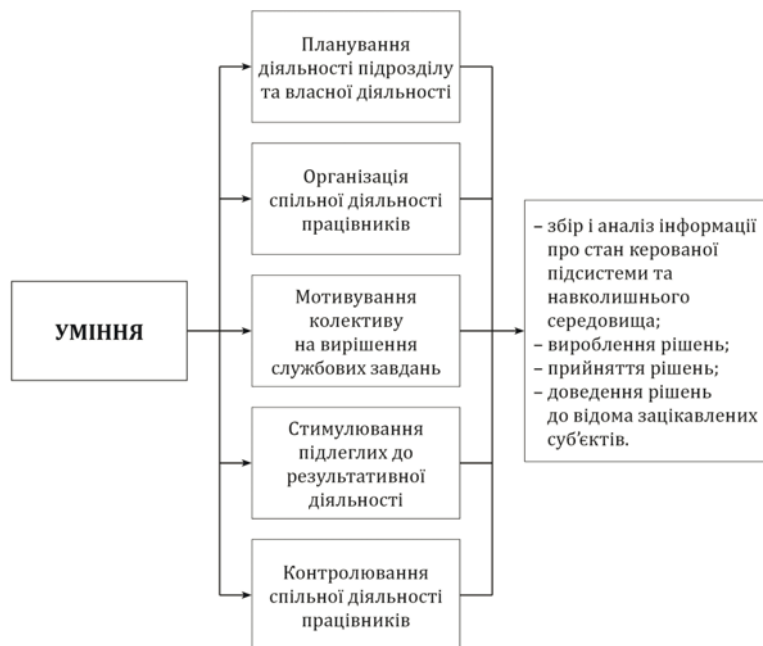
Рис. 5. Структура функціонально-діяльнісного компонента професійної компетентності керівника

Таким чином, модель професійної управлінської компетентності керівника підрозділу поліції виступає у вигляді системи професійних знань і умінь, що забезпечують у своїй сукупності ефективність застосування технологій цілеспрямованого впливу на процеси, що відбуваються в підпорядкованій керівникові формальній організаційній ланці, створюють необхідні умови для вирішення завдань, які поставлені перед поліцейським підрозділом. На наш погляд, охарактеризована вище структура професійно-управлінської компетентності може використовуватись як орієнтир при розробці програм професійної управлінської підготовки керівників поліцейських підрозділів за відповідними напрямками і специфікою діяльності.