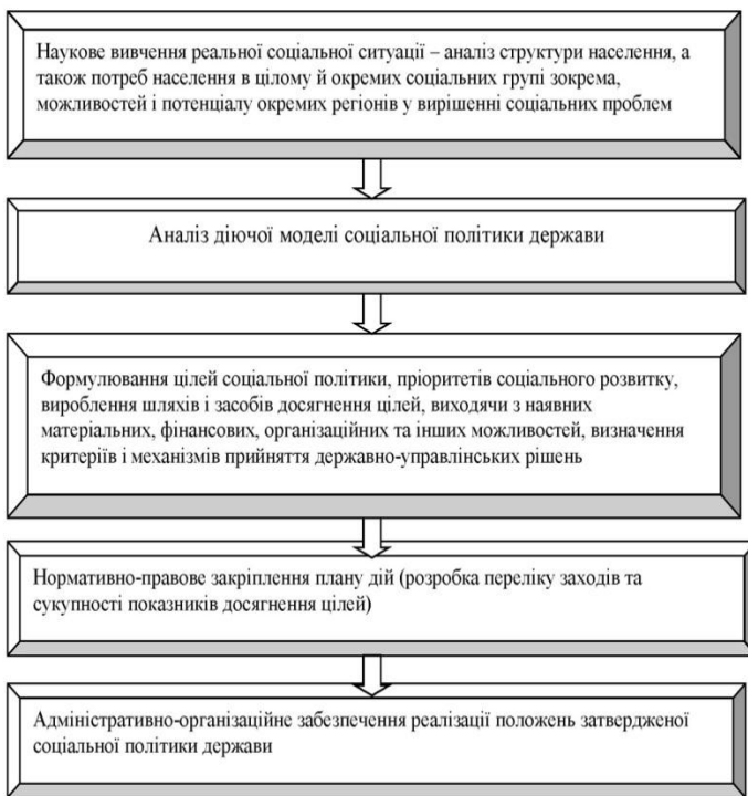
Рис. 2. Алгоритм формування та реалізації стратегії соціальної політики

Відзначимо, що формування та реалізація стратегії соціальної політики передбачає здійснення ряду дій (рис. 2).