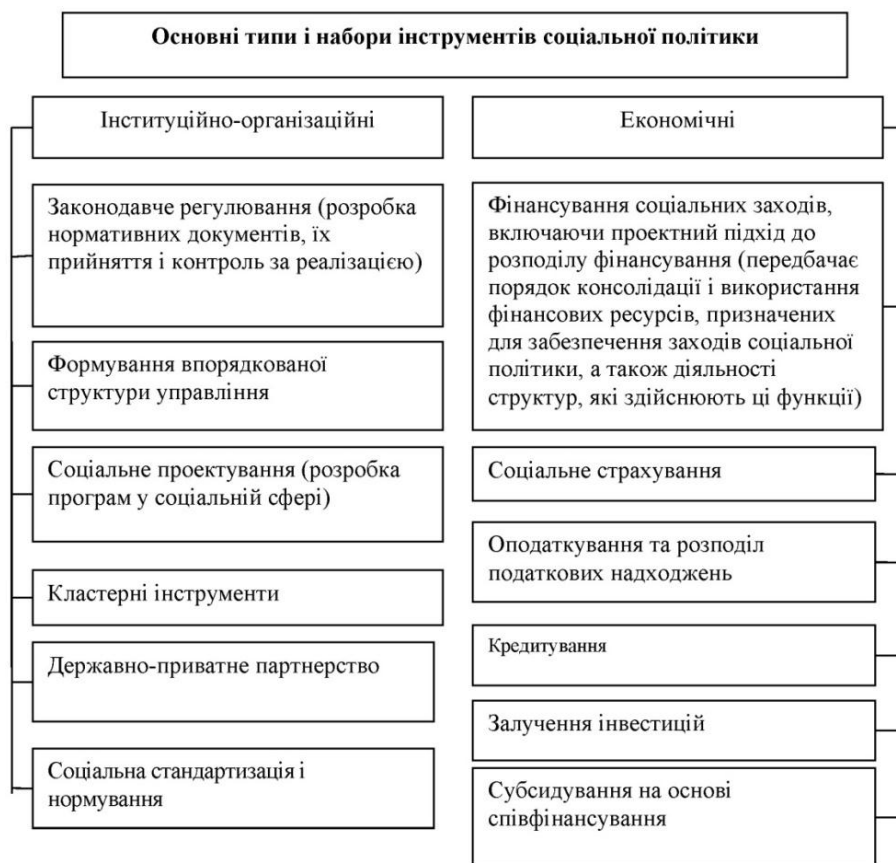
Рис 4. Основні інструменти розробки та реалізації соціальної політики

Вважаємо за доцільне здійснити поділ розглянутих інструментів соціальної політики на традиційні та сучасні інноваційні (табл. 1), що зумовлено сучасни-