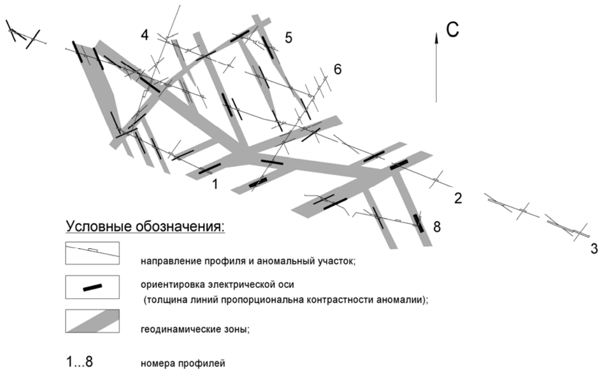
Рис. 1. Результаты структурно-геодинамического картирования, выполненного на участке «Грабовский»