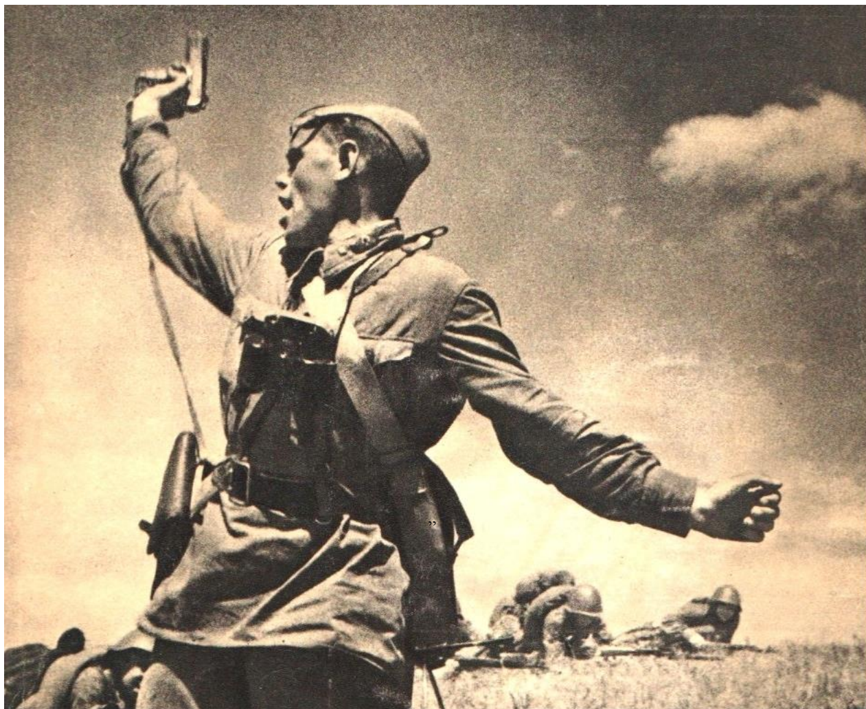
Рис. 1. Світлина Макса Альперта “Комбат”

Мова у ній йтиме про подію, зафіксовану у загальновідомій світлинці радянського фотокореспондента Макса Альперта під назвою “Комбат”. Вона була розтиражована мільйонами примірників в різноманітних вітчизняних і зарубіжних виданнях. На фотографії зображений командир з пістолетом у руці, піднятою над головою, який в момент високого духовного пориву піднімає бійців в атаку.