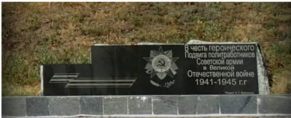
Рис. 4. Гранітна стела у підніжжя Меморіалу

Біля підніжжя Меморіалу стоїть гранітна стела, на якій викарбувані слова: “В честь героического подвига политработников Советской Армии в Великой Отечественной войне 1941-1945 гг.”. А нижче, дрібнішими літерами: “Подвиг А.Г. Еременко”.