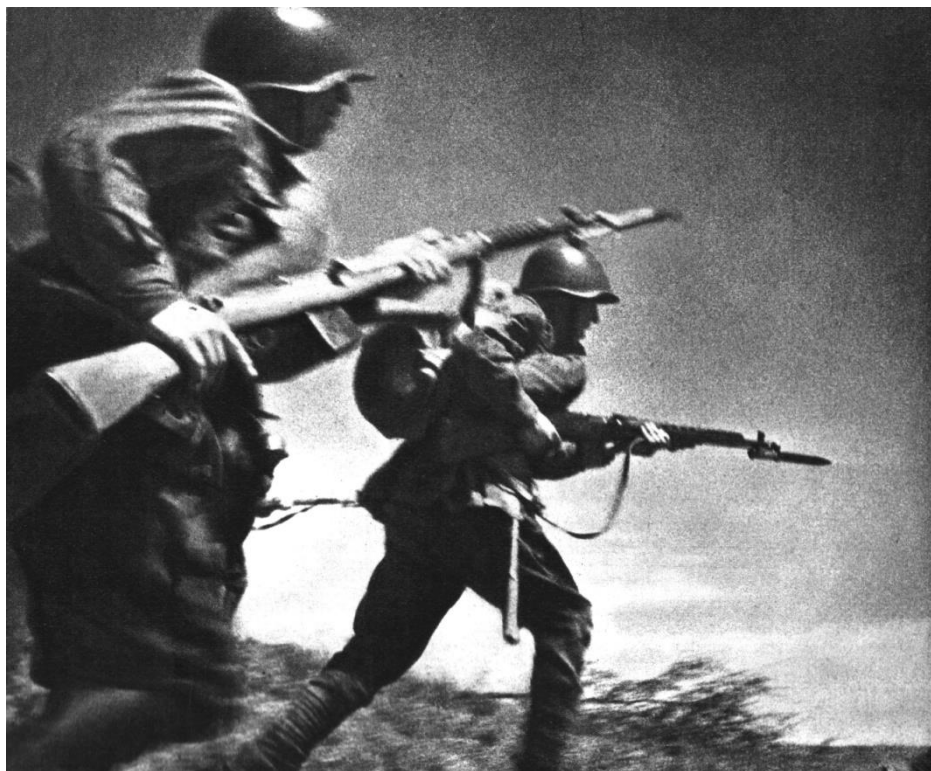
Рис. 5. Світлина М. Альперта “В атаку!”

У книзі опубліковано шість кращих світлин воєнного часу, а першою стоїть “В атаку!”. Ця світлина подається нижче.