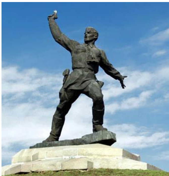
Рис. 3. Меморіал “Пам’ятник подвигу політработників”

“На монументе “Комбат” увековечен героический подвиг нашего земляка. увековечен героический подвиг нашего земляка. Политрук Еременко Алексей Гордеевич. Погиб 12 июля 1942 г.”.