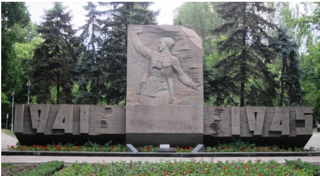
Рис. 2. Горельєф “Комбат”

Алея Слави – добре відоме всім жителям, зразково упорядковане місце. Тут ростуть дубки, посаджені Героями Радянського Союзу, а з ранньої весни до пізньої осені – квітнуть квіти.