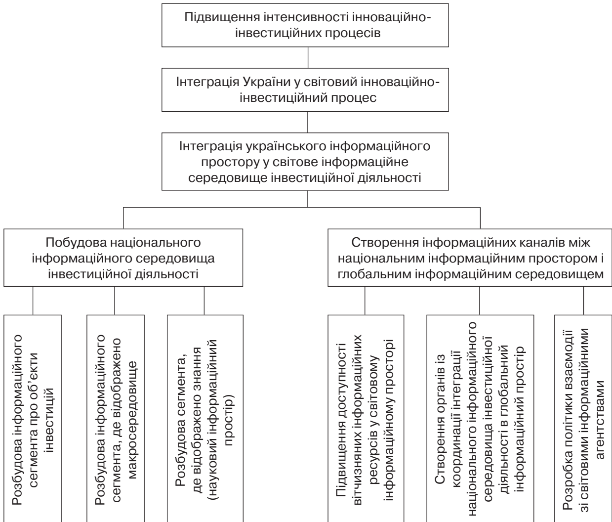
Рис. 1. Стратегічні цілі інтеграції українського середовища інвестиційної діяльності у відповідні сегменти світового інформаційного простору

більшій інтегрованості України у світовий інноваційно-інвестиційний процес. Таким чином, стратегічною метою другого порядку й водночас засобом досягнення мети вищого порядку є забезпечення інтегрованості України у світовий інноваційно-інвестиційний процес.