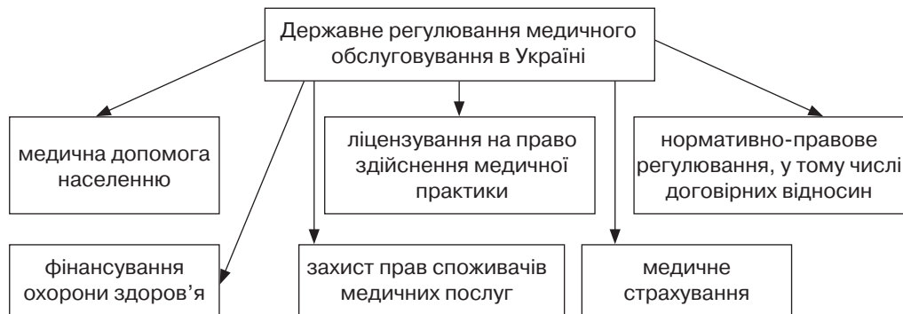
Рис. 2. Напрями державного регулювання медичного обслуговування в Україні

Фінансування та страхування в медицині — актуальне питання. Реальні механізми фінансування відсутні, а очікування соціуму напружені. Не виконуючи зобов’язань із забезпечення норм Конституції, де можливість такого виду страхування прописана (ч. 1 ст. 49), державні органи лишають питання відкритим щодо джерел фінансування. Проте інструменти фінансування, зокрема приватні інвестиції, які повинні бути забезпечені протекціоністською політикою держави, давно відомі і дискусії не підлягають. Страхові компанії функціонують неефективно.