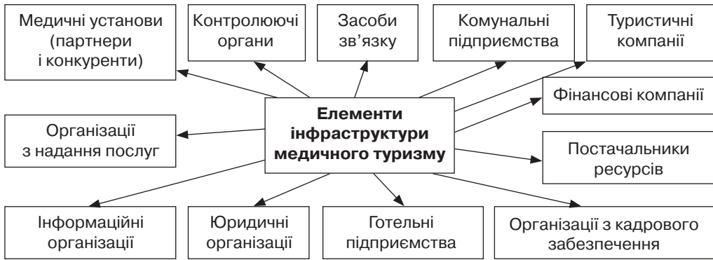
Рис. 1. Базові елементи інфраструктури медичного кластера в туристичній системі

вимог нормативно-правового забезпечення і відповідності ліцензійних вимог: охорони здоров'я, дотримання прав пацієнтів, санітарно-гігієнічних, пожежних, охорони праці, договірних відносин тощо.