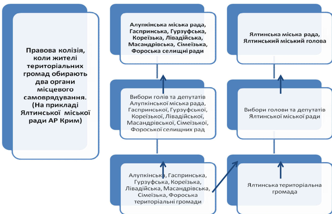
Рис. 2. Правова колізія на прикладі Ялтинської міської ради АР Крим

Проблемним у цій ситуації є те, що відповідно до Закону "Про місцеве самоврядування в Україні", інших актів законодавства Ялтинська міська, Алупкінська міська рада, Гаспринська, Гурзуфська, Кореїзька, Лівадійська, Масандрівська, Сімеїзька, Фороська селищні ради мають однакові повноваження, які одночасно реалізуються на одній і тій самій території, що породжує конфлікт компетенції та складну систему одночасного представлення інтересів територіальної громади кількома органами місцевого самоврядування базового рівня. Правова колізія на прикладі Ялтинської міської ради показана на рис. 2.