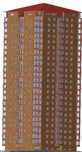
Рис. 2. Модель поверху і будівлі