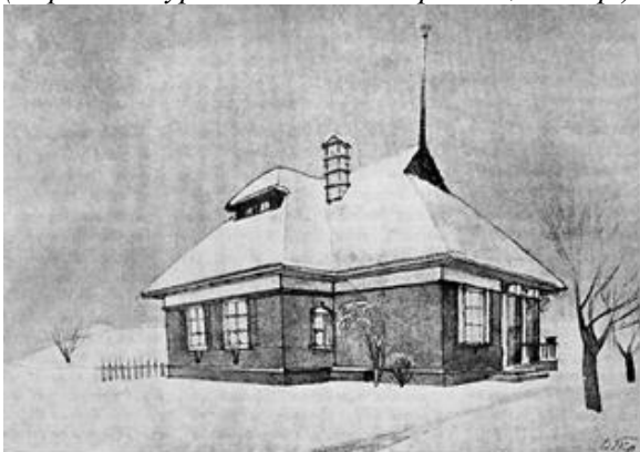
Рис. 5. Колгоспний житловий будинок на 3 кімнати, 1937 р., архіт. В. К. Троценко («Архітектура Радянської України», 1939 р.)

Охорона пам'яток і пам'яток. У запалі класової боротьби перших років радянської влади діставалося не лише ідеологічним супротивникам і ворогам, але й матеріальним об'єктам, у яких будівники нового ладу вбачали втілення чужих та ворожих поглядів — насамперед церквам, але цієї сумної долі не уникали й інші споруди. З часом навіть найзатятіші послідовники соціалістичного реалізму і нового побуту зрозуміли, що архітектурна спадщина має не лише ідеологічний, але й науковий та практичний зміст.