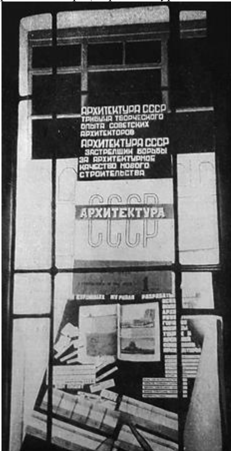
Рис. 2. Виставка архітектури в вікнах на ул. Горького в Москві з виданням «Архітектура СРСР», 1934 р.

Для українських архітекторів надзвичайно важливе значення мають пошуки національних форм ..., але немає відповіді якими шляхами йти, щоб створити національні форми соціалістичної архітектури, –