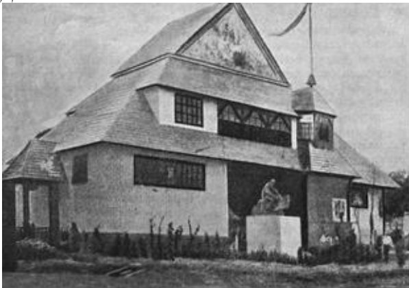
Рис. 4. Павільон УРСР на сільськогосподарській виставці, 1923 р., архіт. В. К. Троценко («Архітектура Радянської України», 1940 р.)