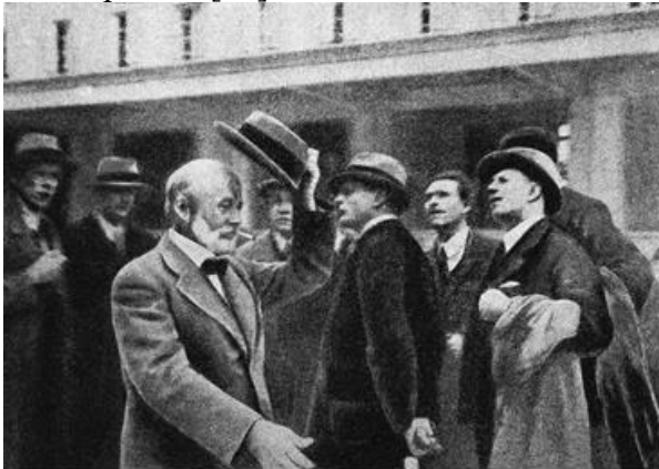
Рис. 1. Огюст Перре серед радянських архітекторів біля будинку «Mobilier National» у Парижі, 1935 р. («Архітектура СРСР», 1936 р.)

«соціалістична архітектура несе єдиний зміст в національних формах усіх звільнених народів» [19].