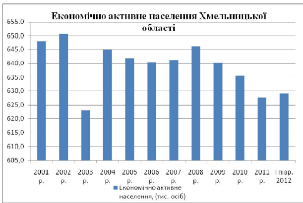
Рис. 1. Динаміка економічно активного населення Хмельницької області, [6,7]