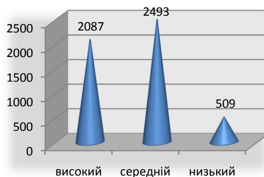
Рис. 4. Рівень задоволення випускників робочим місцем

Отже, можна зробити висновки, що існуюча система професійної підготовки потребує внесення певних змін, в розрізі ринку освітніх послуг та ринку праці, що буде забезпечувати формування у працівників тих якісних характеристик, які необхідні на сучасних підприємствах, а в свою чергу роботодавці будуть створювати відповідні умови праці для кваліфікованих робітників.