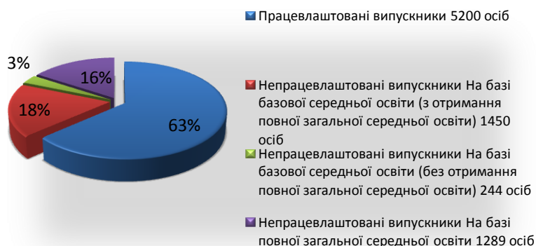
Рис. 2. Стан працевлаштування випускників ПТНЗ Вінницької області станом на 01.12.2010 року

Розглянемо причини непрацевлаштування випускників через 6 місяців після закінчення навчального закладу. Серед опитаних непрацевлаштованих випускників 2,8% розчарувались отриманою професією, 7,2% взагалі не бажають працевлаштовуватись, 21,4% респондентів зазначили, що через відсутність вакантних робочих місць не мають можливості влаштуватися на роботу, разом з тим жоден респондент не відніс до причин непрацевлаштування відсутність пропозицій від ПТНЗ, що вказує на активну позицію навчальних закладів щодо проблеми працевлаштування випускників.