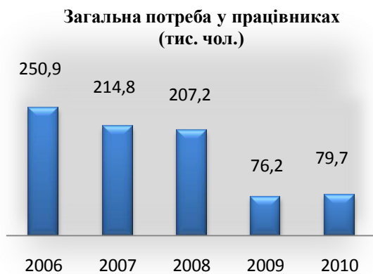
Рис. 1. Потреба у працівниках за видами економічної діяльності

Разом з тим, рівень зареєстрованого безробіття в цілому по країні на початку 2011 р. зріс на 0,1 відсоткового пункта і на 1 лютого 2011 р. становив 2,1% населення працездатного віку. У сільській місцевості цей показник збільшився на 0,3 відсоткового пункта і становив 3,2% населення працездатного віку, у міських поселеннях – на 0,1 відсоткового пункта і 1,7% відповідно.