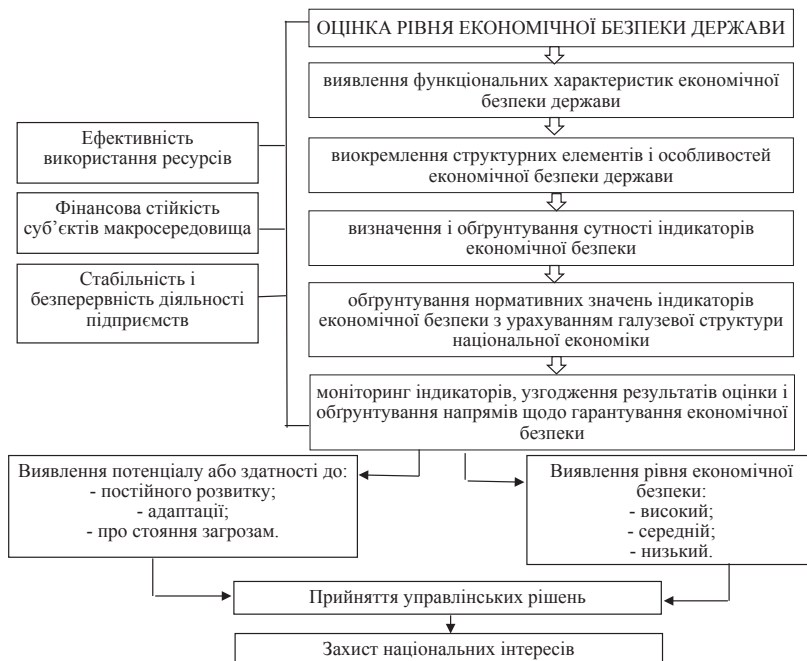
Рис. 1. Етапи оцінки і виявлення рівня економічної безпеки держави Джерело: [7]

Виклад основного матеріалу досліджень. Для оцінки рівня економічної безпеки використовується алгоритм, відповідні індикатори та їх порогові значення, відповідні методики оцінки, а саме: моніторинг основних макроекономічних показників і порівняння їх із середньосвітовим значенням; оцінка темпів економічного зростання з використанням оцінки основних макроекономічних показників в динаміці; методи експертної оцінки; метод аналізу та обробки сценаріїв; методи оптимізації; теоретико-ігрові методи; мето-