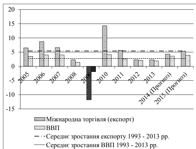
Рис. 1. Динаміка міжнародної торгівлі та ВВП за 2005–2015 рр.

тенденції до здійснення світової торговельної діяльності свідчать про високу її значимість як зовнішнього фактору, що впливає на розвиток національної економіки. Для підтримання глобалізаційних процесів необхідно відповідати заданому рівню міжнародної торгівлі. Так, у глобалізованому світі досягнення економічного росту залежить від ступеню інтеграції вітчизняних підприємств та їх продуктів у світову економіку, державної підтримки інноваційного, конкурентоспроможного виробництва та підвищення рівня професійної підготовки на ринку зайнятості, наявності макроекономічного та інституціонального середовища сприяння соціальному розвитку та досягненню соціальної справедливості у суспільстві [1]. Конкурентоспроможність української економіки обумовлюється