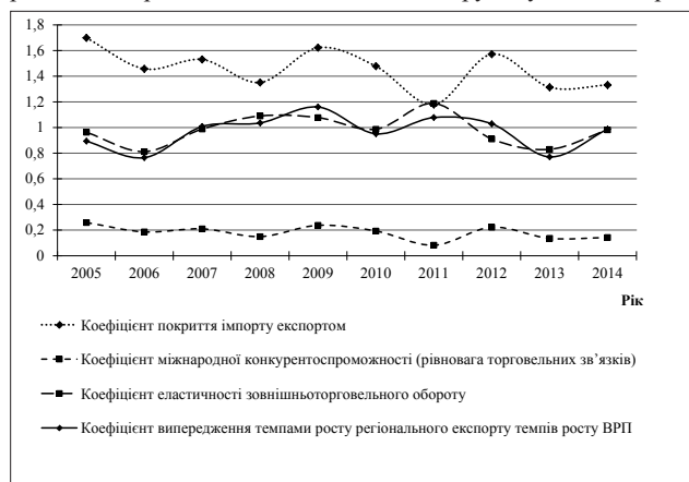
Рис. 3. Динаміка основних коефіцієнтів рівня розвитку та збалансованості міжнародної торгівлі Сумської області за 2005–2014 рр.

Коефіцієнт міжнародної конкурентоспроможності, або рівновага торговельних зв'язків, демонструє ступінь експорто-