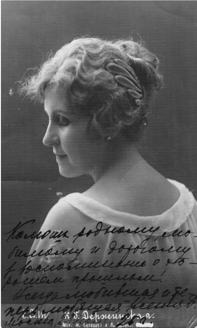
Ксенія Держинська, автограф, Москва 1925(26 ?) р. [друкується вперше]