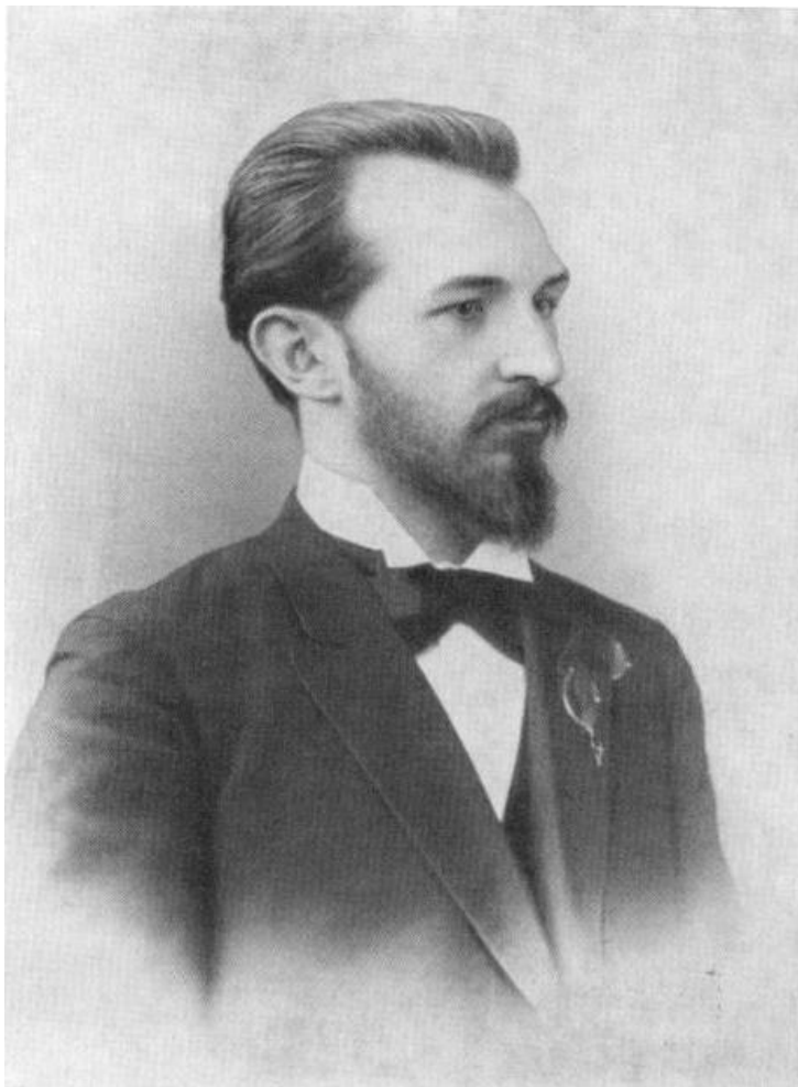
Олександр Оссовський, початок 1900-х років.