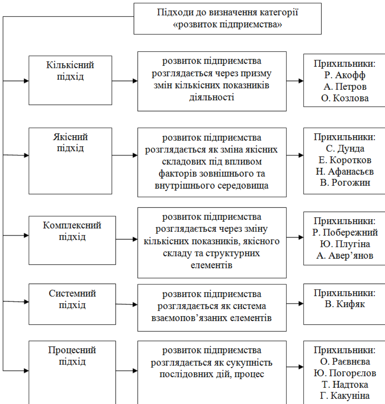
Рис. 1. Підходи до визначення розвитку підприємства

У результаті аналізу визначення розвитку підприємства, наданого сучасними науковцями, можна виділити п'ять підходів до трактування даної категорії (рис. 1).