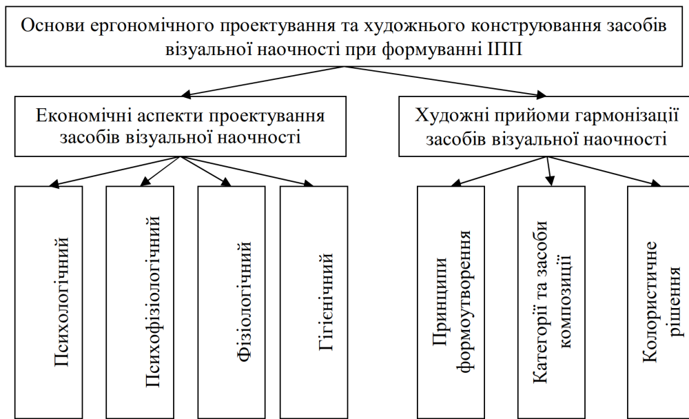
Рис. 2. Схема проектування та конструювання наочності в процесі створення ІПП