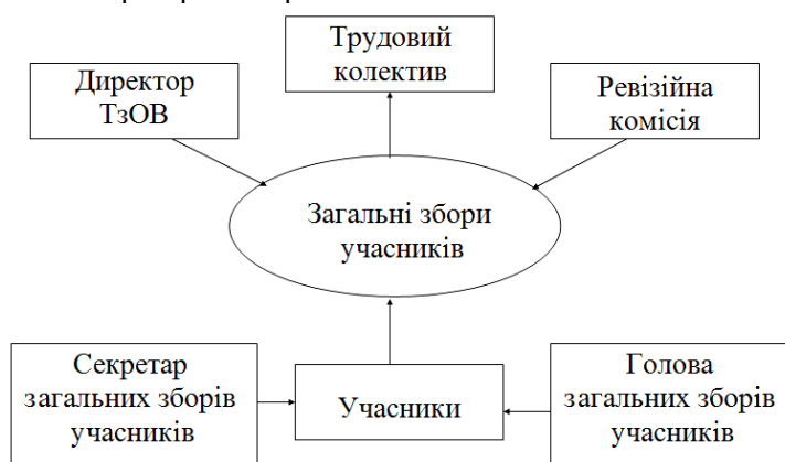
Рис. 2. Управлінська структура підприємства ТзОВ «Городище»

Управлінська структура ТзОВ «Городище» складається з декількох ланок, які взаємоузгоджені між собою (рис. 2). Вищим органом управління підприємства є загальні збори учасників товариства. Представники можуть бути постійними або призначеними на певний строк. Збори обирають голову, секретаря загальних зборів учасників. Директор ТзОВ і жоден із членів ревізійної комісії не може бути обраним головою або секретарем зборів.