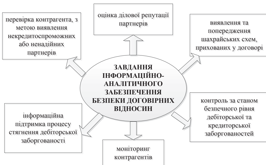
Рис. 1. Завдання інформаційно-аналітичного забезпечення гарантування безпеки договірних відносин

Основні завдання інформаційно-аналітичного забезпечення безпеки договірних відносин наведено на рис. 1.