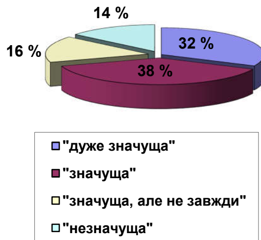
Рис. 1. Значущість професійної відповідальності в управлінській діяльності менеджера (за самооцінними судженнями студентів)

Така діагностувальна картина дозволяє дійти висновку про недостатню поінформованість магістрантів щодо суті та функціональної ролі професійної відповідальності в майбутній управлінській діяльності і необхідність формування підвалин професійної відповідальності на етапі підготовки майбутнього менеджера.