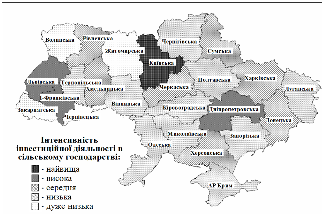
Рис. 2. Групування регіонів України за інтенсивністю інвестиційної діяльності в сільському господарстві у 2008 році.