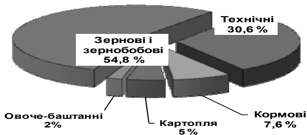
Рис. 1. – Структура посівів основних сільськогосподарських культур в Україні за 2014 р.

Розраховано автором за даними Держкомстату України