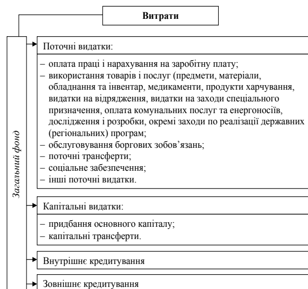
Рис. 2. Чинна класифікація витрат організацій водного господарства

Дослідження фінансової звітності організації водного господарства за 2016 рік свідчить, що витрати за загальним фондом в цілому поділяються на поточні та капітальні. Окрім цього, такі установи здійснюють внутрішнє й зовнішнє кредитування (рис. 2).