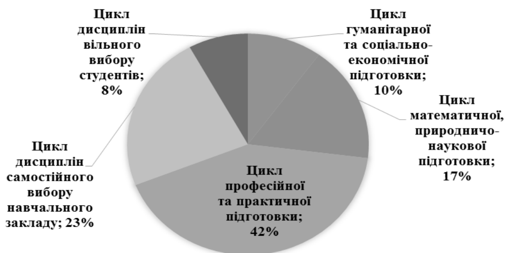
Рис. 1. Розподіл навчального часу за циклами підготовки бакалаврів за напрямом 6.050102 «Комп'ютерна інженерія»

Частка дисциплін циклу математичної, природничо-наукової підготовки досить велика – 17 % (рис. 1), зокрема на дисципліну «Фізика» передбачено 270 годин (5 кредитів ECTS), що складає 18 % від загальної кількості дисциплін цього циклу (рис. 2). Отже, фізика є фундаментальною дисципліною у підготовці бакалавра з комп'ютерної інженерії.