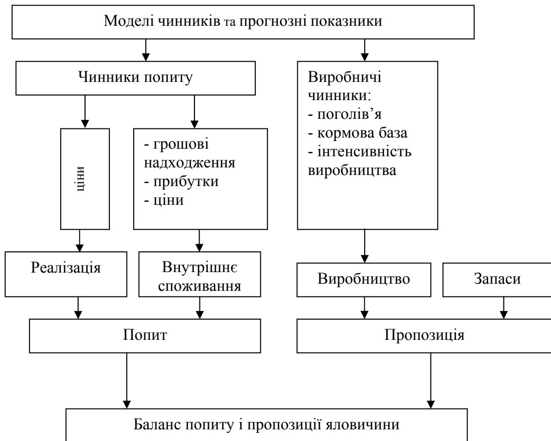
Рис. 1. Схема прогнозування і розрахунків балансу попиту та пропозиції яловичини

Моделюванню розвитку агропромислових підприємств та об'єднань повинні передувати моделі ринкової рівноваги, теорія якої вимагає встановлення рівності (балансу), між попитом і пропозицією на всіх ринках. Попит, як правило, визначає верхній рівень ціни, тобто максимальну ціну, яку підприємство може запросити за свій товар. Для установа попиту на продовольчі товари їх ціни слід пов'язувати із зростанням виробництва і збільшенням доходів населення до рівня прожиткового мінімуму. У графічному вигляді баланс між попитом і пропозицією можна подати на прикладі виробництва та реалізації яловичини (рис. 1).