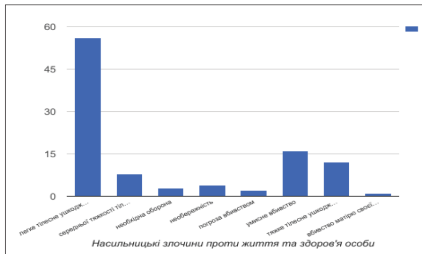
Діаграма № 1

Саме в цьому контексті доречно навести класифікацію залежно від ініціюючої сторони. Вивчаючи насильницьку злочинність, Б.М. Головкін запропонував ситуацію, ініційовану злочинцем, ініційовану потерпілим, змішану ситуацію й ситуацію, ініційовану третіми особами. Досить часто конфлікт пов'язаний зі змішаним типом, коли його розпалюють і злочинець, і потерпіла особа [6, с. 50]. Також у цій схемі помітно деяке розмивання кордонів між класифікаціями ситуацій, так само як і з мотивами насильницьких злочинів. На особливу увагу за-