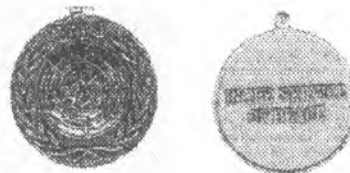
Рисунок 3 – Типовая медаль

3. Типовой образец – бронзовый знак, на лицевой стороне которого помещены рельефное изображение эмблемы ООН и над ней – выполненные в рельефе буквы "UN" (ООН); на оборотной стороне располагается выполненная в рельефе надпись "IN THE SERVICE OF PEACE" (На службе миру) (рис.3). Этот типовой знак используется для всех миссий ООН, за исключением двух упомянутых выше [3]. Первой операцией Организации Объединенных Наций, отмеченной медалью, был Орган ООН по наблюдению за выполнением условий перемирия, учрежденный в 1948 году с целью контроля соблюдения соглашения о прекращении огня в Палестине. Позднее медалью ОНВУП награждался и персонал Группы ООН по наблюдению в Ливане (ГОООНЛ), Операции ООН в Конго (ОНУК). Однако вскоре возобладало мнение о необходимости выпуска медалей применительно к каждой операции. С учетом экономической целесообразности была принята концепция стандартизации самой медали и производства индивидуальных лент/орденских планок к ним. Медаль ОНВУП в 1966 году была утверждена Генеральным секретарем ООН в качестве типового образца (рис.4).