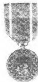
Рисунок 4 – Медаль ОНВУП

Помимо вышеупомянутых медалей в системе Организации Объединенных Наций функционируют и другие награды. Лица, временно проходящие службу в Центральных учреждениях ООН, награждаются медалью «Центральные учреждения ООН». С 1995 года военнослужащие и гражданские полицейские, принимавшие участие в специальных операциях, награждаются медалью «За особые заслу-