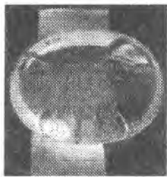
Рисунок 5 – Медаль Дага Хаммаршельда

ги». В комбинации с ней могут использоваться специальные металлические планки с наименованием операции или соответствующей организации системы ООН, ответственной за ее проведение. Во исполнение резолюции Совета Безопасности ООН 1121 (1997) с 1 января 2001 года сотрудники военных, полицейских или гражданских компонентов операций ООН по поддержанию мира, погибшие при исполнении своих служебных обязанностей, награждаются медалью Дага Хаммаршельда, представляющей собой эллипсоид из прозрачного бесцветного свинцового хрусталя с нанесенными на него методом пескоструйной гравировки имени и даты гибели награжденного, эмблемы ООН и надписи «Медаль Дага Хаммаршельда. На службе мира» на английском и французском языках [4] (рис.5).