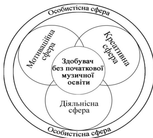
Рис. 1 Сфери персонального освітнього середовища професійної підготовки майбутніх учителів музичного мистецтва без початкової музичної освіти

проводилось на основі діаграми Ейлера-Венна (рис. 1). Такий підхід мав місце в працях О. Єжової, Ю. Єчкало, Л. Карпової [2; 4; 10]. У нашому підході цей простір представлено як сукупність чотирьох сфер, кожна з яких є відповідною підструктурою, що сприяє формуванню конкретного компоненту персонального освітнього середовища, а саме: діяльній, мотиваційній, креативній та особистісній сфери [6; 9].