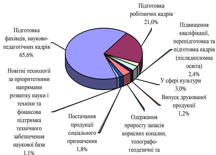
Рис. 2. Структура затверджених обсягів державного замовлення на закупівлю товарів, виконання робіт, надання послуг для державних потреб 2012 році

Найважливіші положення концепції державної системи замовлення такі [4, с. 205]: