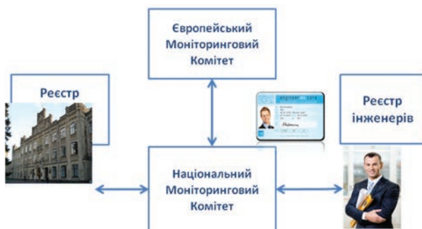
Рис. 3. Процедура одержання європейських сертифікатів і включення інженерних програм до реєстру FEANI INDEX (схема)

Процедура отримання для всіх трьох перелічених вище документів є однаковою. Вона представлена на рис. 3 і зовні нагадує процедуру захисту дисертації. На першому етапі аплікант подає заяву до Національного моніторингового комітету (НМК). На засіданні НМК відповідна заява розглядається та приймається, скажімо, позитивне рішення. НМК є своєрідним аналогом Спеціалізованої ради із захисту дисертацій. Після розгляду в НМК документи відправляються в Брюссель до ЄМК, який є аналогом ВАКУ. В разі