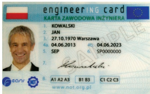
Рис. 1. Зовнішній вигляд зразка Європейського паспорту інженера

Ініціатива № 1. Європейський паспорт інженера. Це своєрідний аналог Болонської системи для працюючих. Європейська комісія ініціювала програму “Мобільність”, яка має на меті поліпшити умови руху висококваліфікованої робочої сили всередині ЄС. Зокрема, планується створення єдиного державного документа для певних категорій працівників. Перш ніж упровадити такий професійний паспорт, як державний документ він тестується в кількох країнах за підтримки громадських об'єднань. Зокрема, паспорт інженера створюється відповідно до розробок FEANI. Зараз ця система тестується в 13 країнах Європи. Україна першою з країн поза межами ЄС одержала від FEANI право на випуск цього документа (зрозуміло, в тестовому режимі). Планувалося, що паспорт інженера буде впроваджений як державний до-