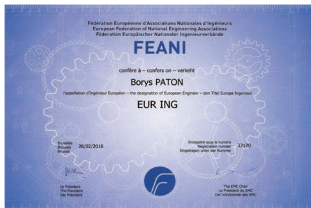
Рис. 2. Зовнішній вигляд диплома EUR ING, виданого академіку Б.Є. Патону

Ініціатива № 2. Найвищий почесний європейський титул для інженерів EUR ING. Критерії одержання Європейського паспорта інженера досить формальні — претенденту достатньо мати відповідну технічну освіту та стаж роботи за фахом не менше трьох років. Критерії для одержання диплома EUR ING значно жорсткіші. Крім підтвердження рівня своєї освіти, аплікант повинен написати стислий “твір” про свою професійну роботу, в якому аргументовано продемонструвати володіння інженерними навичками. Аплікація доповнюється копіями виконаних з участю заявника технічних проектів. Дуже приємно повідомити, що перша аплікація з України одержала позитивну оцінку від FEANI. Першим отримав найвищий почесний європейський титул для інженерів академік Б.Є. Патон (рис. 2).