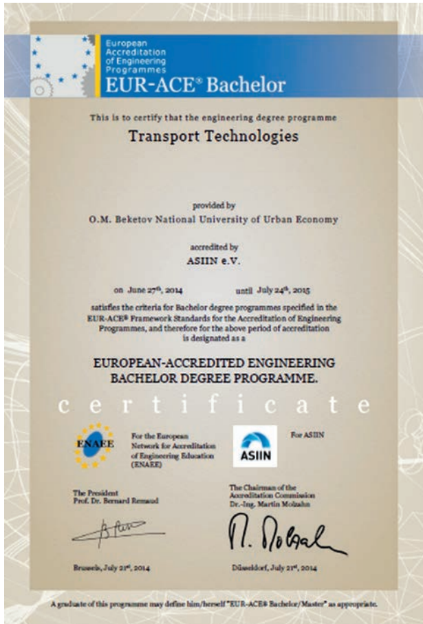
Рис. 5. Копія сертифіката EUR-ACE® (рівень “Бакалавр”), виданого українській програмі “Транспортні технології” з Харківського національного університету міського господарства ім. О.М. Бекетова