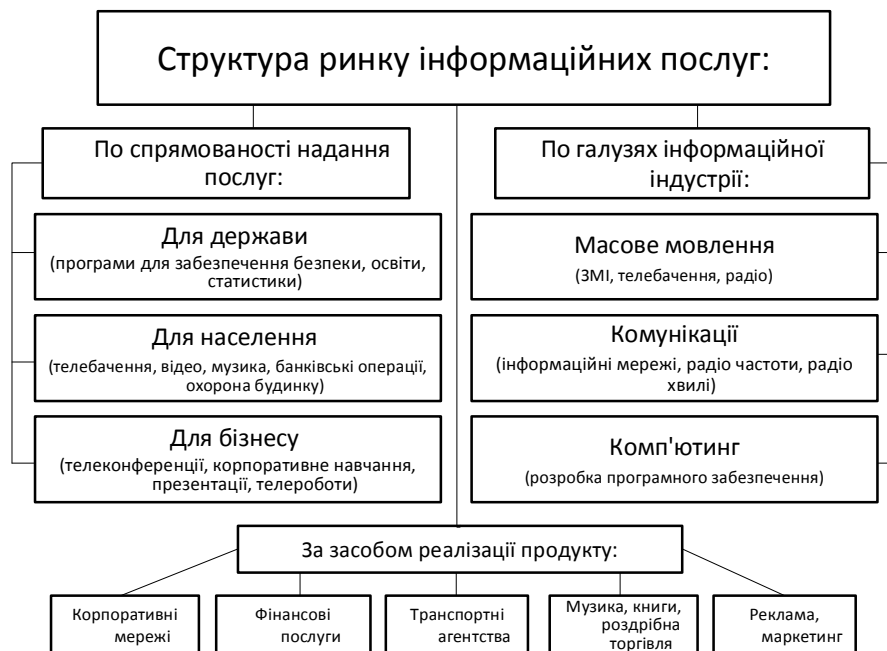
Рис. 1. Структурування характеристик ринку інформаційних послуг.