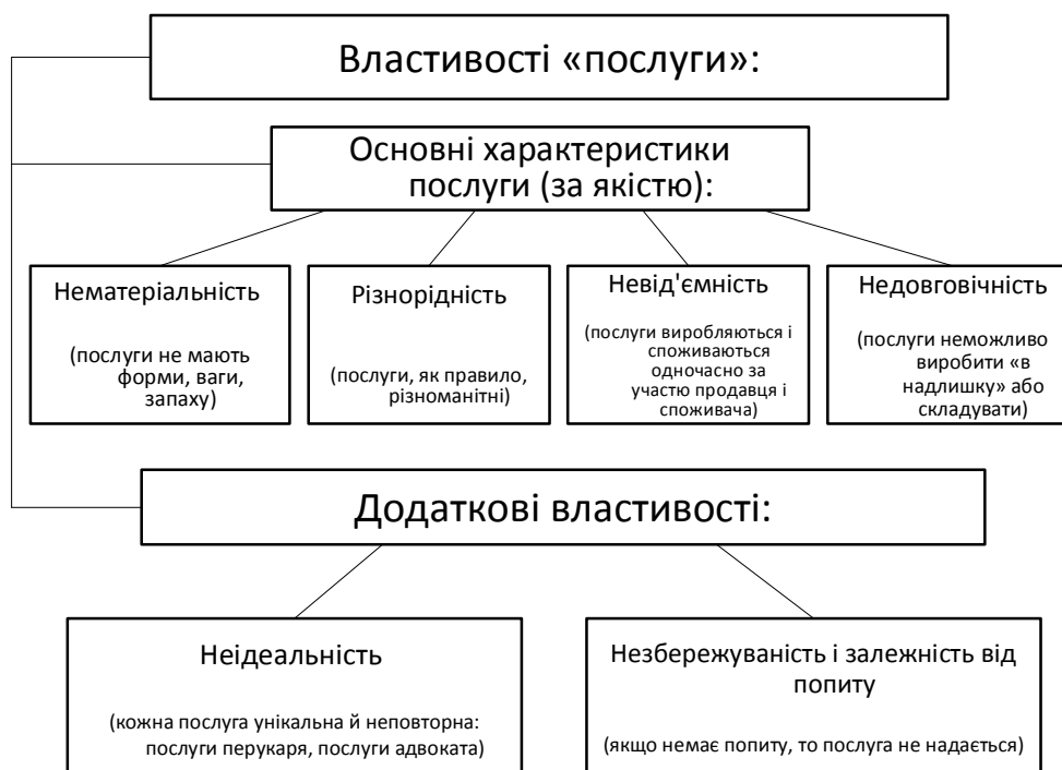
Рис. 2. Основні та додаткові властивості послуг.

кації послуг. Це пов'язано з тим, що існує безліч видів послуг, а забезпечення населення послугами виступає на цей час найважливішим показником соціально-економічного розвитку.