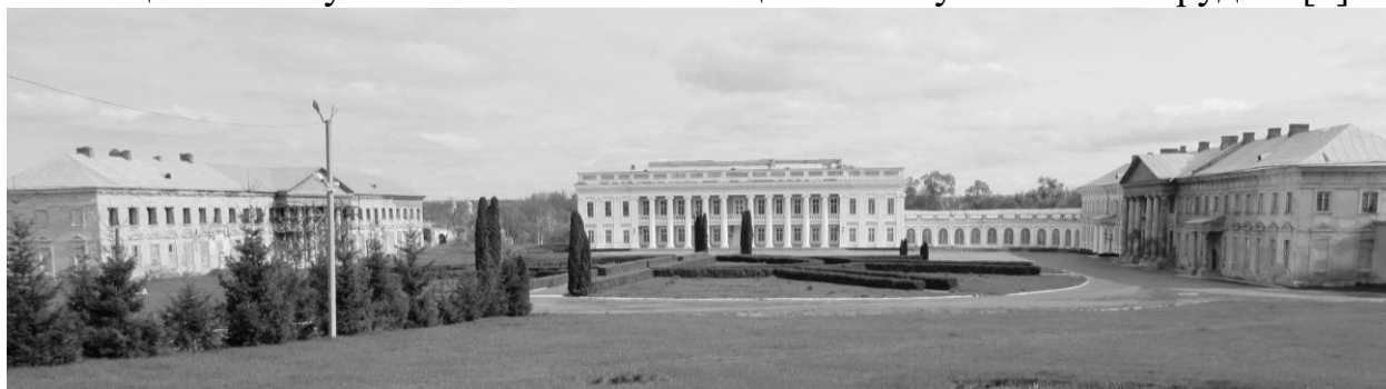
Рис. 1. Палац Потоцького в м. Тульчин. Фото автора 2015 р.

Соціально-економічна основа підкріплювалася географічними чинниками , які впливали на вибір місця розташування палацових ансамблів. Таким чином, обираючи положення архітектурного об'єкта, більшість садибно-паркових утворень зводилася на теренах сіл, за межами повітових міст та при в'їзді у населені пункти, що дозволяло магнатам не обмежуватися у розмаху та масштабах будівництва. Географічна складова, що впливала на розташування панських маєтків була додатковим свідченням могутності та престижу їх власників. Суттєву роль у підкресленні домінантного положення садибно-паркового комплексу в його планувальній структурі відігравали просторово-композиційні та візуальні зв'язки між палацовою та культовою спорудою [2].