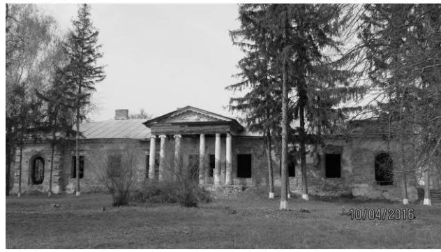
Рис. 5. Палац Комара в Мурованих-Курилівцях Фото автора 2017 р.