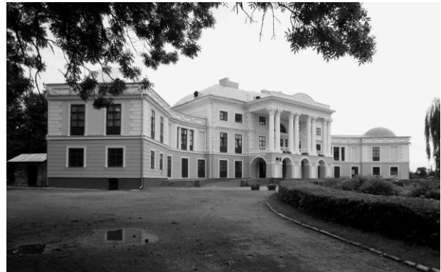
Рис. 4. Палац Грохольських-Можайських у Вороновиці.