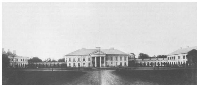
Рис. 7. Палац Грохольських у Стрижавка. Літографія Н. Орди