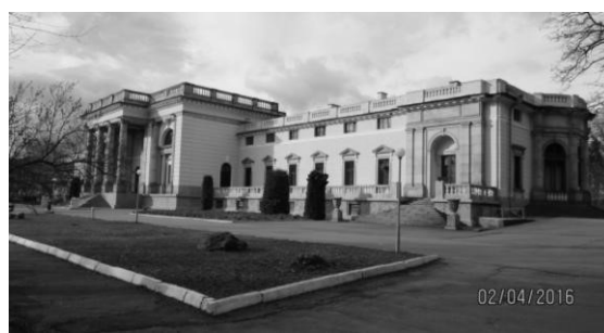
Рис. 9. Палац Б. Потоцького в Немирові. Літографія Н. Орди.