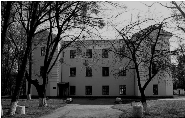
Рис. 3. Палац Грохольських у П'ятничанах.

Зазнали змін існуючі замки-фортеці, які уже втратили своє функціональне оборонне значення, та модернізувалися у палаци (Іванів, Палац Холоневських, 1780 р.р.) [1]. Відповідно замково-палацовий комплекс П'ятничанах родини Грохольських перебудовувався у 1770 роках і являв собою палацовий ансамбль з симетричних, спадаючих до краю об'ємів, в центрі якого знаходився триповерховий головний корпус з боковими вузькими ризалітами, знизу з'єднаних колонадою. Вся композиція будівлі створювала вигляд розімкнутої підкови. Навколо палацу розростався розкішний парк з рідкісними видами дерев та рослин. Корпус та парк збереглися донині та експлуатуються під ендокринологічний диспансер (Рис.3).