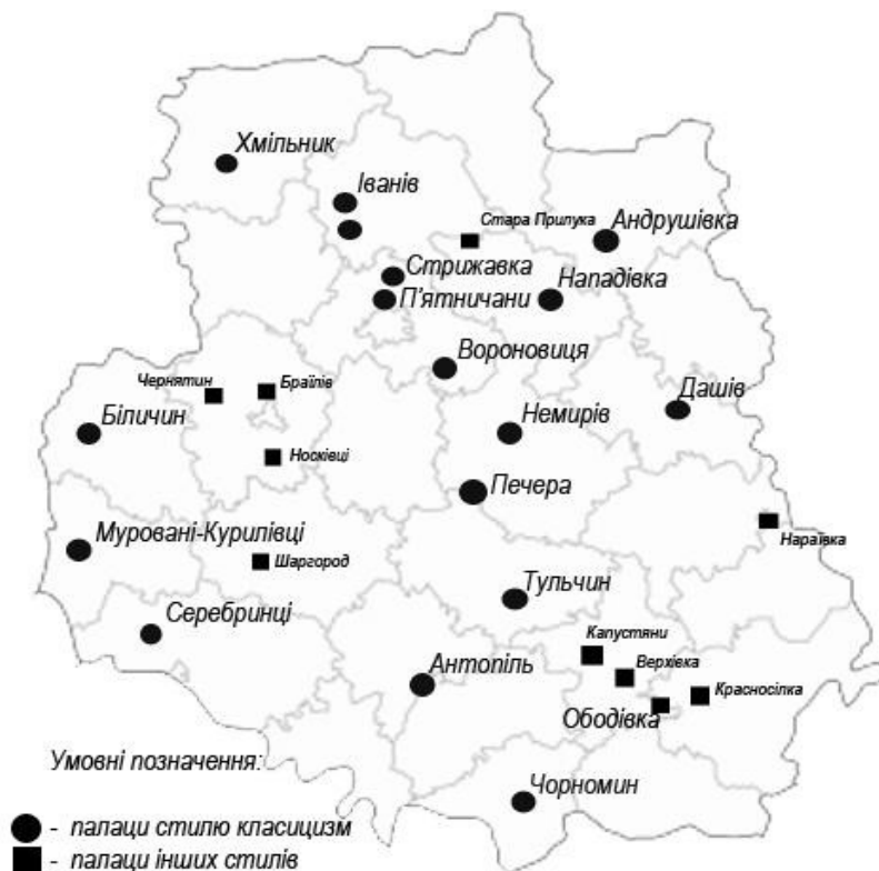
Рис. 2. Карта Вінницької області з розташування палацових комплексів. Розробка автора

Така тенденція спостерігалася також у Волинському регіоні (згідно дис. О.Л. Михайлишин) та на Київщині (згідно дис. Маланюк В. Я.). Залучення до проектування й будівництва палацових маєтків відомих архітекторів обумовило високий якісний рівень архітектурно-просторових рішень. Більшість архітекторів та паркобудівничих були іноземного походження, а саме Жозеф Лакруа, Франц Боффо, Лоренц Гейдон, Іржи Стіброл, Д. Мікклер, Зеннгольц, Франтішек Томаєр.