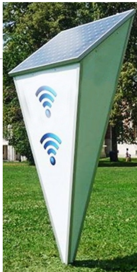
Рисунок 3 – Загальний вигляд устаткування