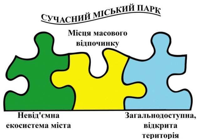
Рисунок 1 – Складові елементи рекреаційної зони міста

У сучасних реаліях значна частина насаджень у парках України вимагає здійснення тих чи інших форм відновлення. Це можливо лише за допомогою проведення низки заходів - лісівничих, лісовідновлюючих, з благоустрою території та інших, спрямованих на трансформацію існуючих ландшафтів з метою посилення їх рекреаційних властивостей[4].