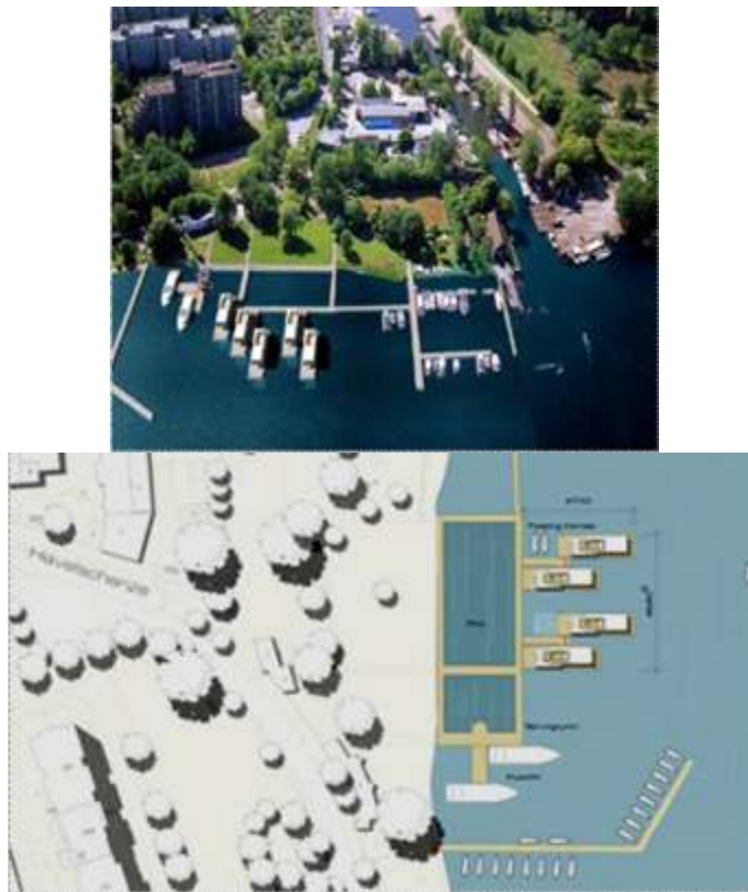
Рис. 4. Вид з пташиного польоту на плавучі будинки та генеральний план поселення плавучих будинків

Будівництво будинків на воді має двояке відношення до оточуючого середовища. З одної сторони – це змінює характер ландшафту, в більшості до негативного. З іншого боку, перебувають у водних будинках громадяни мають можливість «споживати» навколишні ландшафти, якість яких збагачено за рахунок водного дзеркала водою.