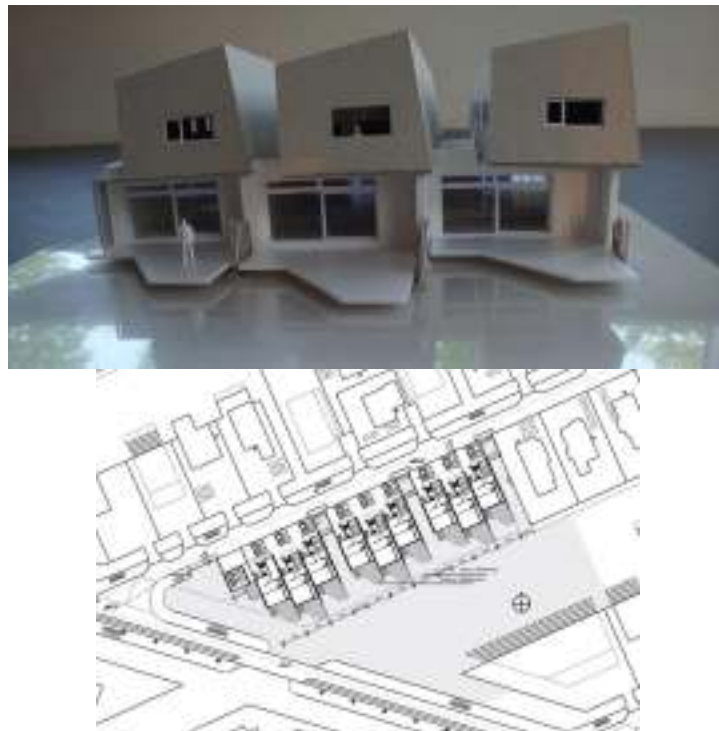
Рис. 6. Макет 'вода + очерет' та генеральний план 'вода + очерет'

Створена BLAUW architecten що залучили для роботи команду FARO architects для створення житлового комплексу.