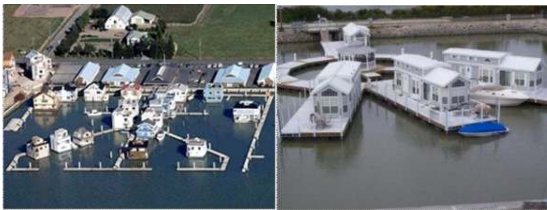
Рис. 3. Приклади схем розміщення плавучих будинків

Плавучі будинки розміщуються в переході зони між сушею та водною гладдю на відносному мілководді. Вона відрізняється наявністю суден з мілкою осадкою на берегах річок та заток. Вони здатні тривалий час знаходитись на одному місці, але при бажанні їх можна відбуксувати на нове місце дислокації. Кілька будинків поєднують між собою перехідними мостами, плотами, навісами, галереями та створюють поселення плавучих будинків.