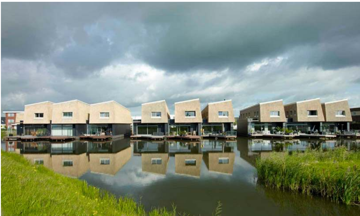
Рис. 5. Вид фасаду зі сторони води плавучих будинків 'вода + очерет'

Є підстави прогнозувати зростання кількості і темпів поширення в перспективі надводних і підводних будівель. Експансія плавучих будівель обумовлена, з одного боку, розвитком авіаційного та водного транспорту, прагненням людей освоювати нові території для розміщення другого житла. З іншого боку, збільшення чисельності населення планети і зростання темпів будівництва залишають все менше вільних територій з атрактивними ландшафтами. За прогнозами IPCC (Intergovernmental Panel on Climate Change), рівень моря протягом цього століття підніметься на 20-90 см. У разі, якщо збудяться прогнози деяких вчених про глобальне потепління клімату та спричиненим ним скороченням площі суші і дефіцитом земельних ресурсів, то надводні і повітряно-надводні другі житла отримають додаткові аргументи на користь свого розвитку.