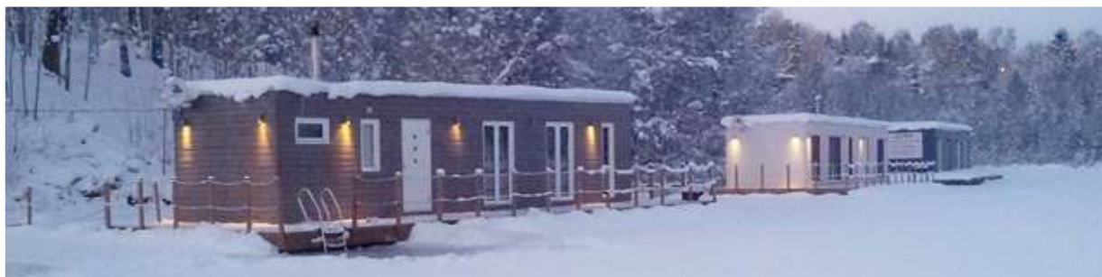
Рис. 2. Плавучі будинки зимою

- Наявність на будинку-кораблі рятувальних засобів, у тому числі у вигляді плотів, шлюпок, рятувальних жилетів і ін.