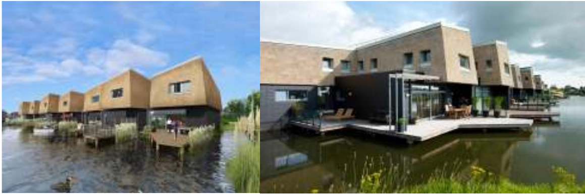
Рис. 8. Перспективне зображення плавучих будівель 'вода + очерет'

Концептуально жити можна на будь-якій території. Архітектори створили концептуально новий тип забудови. Якість життя на воді повинна практично не відрізнятися від звичайного життя у будинку на суші. Такі будинки повинні тримати користувача в уяві того що будинки на воді створюють новий концепт будівель, того що будинок доповнює ландшафт та гарантує довге життя.