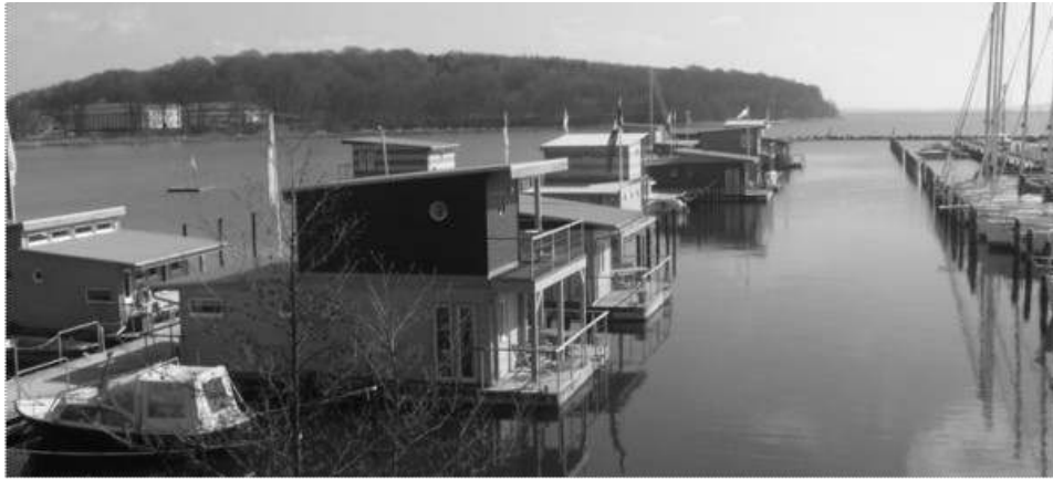
Рис. 1. Перспективне зображення плавучого кварталу

Багато плавучого житла зводиться на плоскодонних плавучих основах: баржах, човнах, катамаранах, катерах. У розвинених країнах плавучі будинки в якості перших житла використовуються незначно, в основному вони призначені для тимчасового перебування під час відпустки й у вихідні дні і використовуються як другі житла.