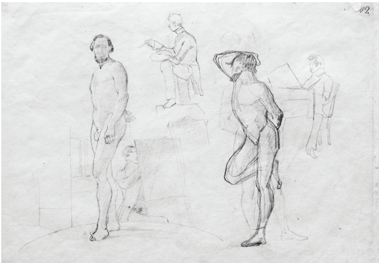
Натурник та учні Академії мистецтв. 1839–1842 рр. Папір, олівець