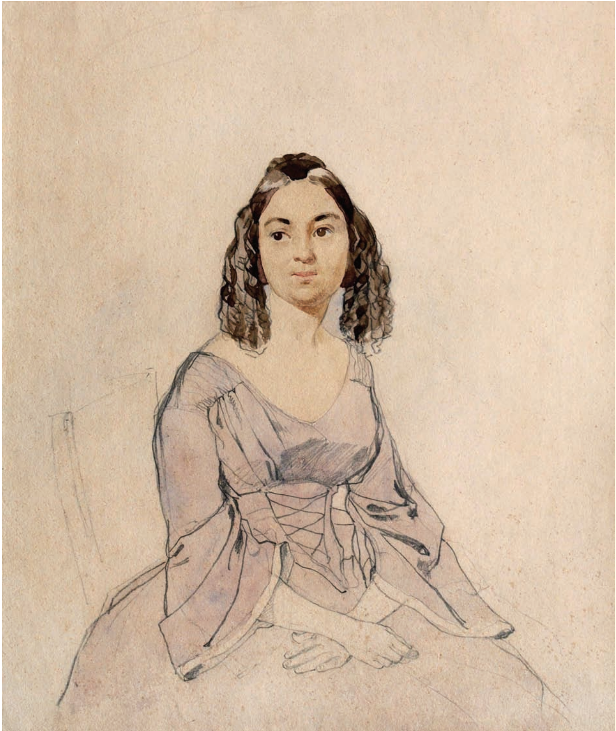
Портрет невідомої в бузковій сукні. 1845–1846 рр. Папір, акварель