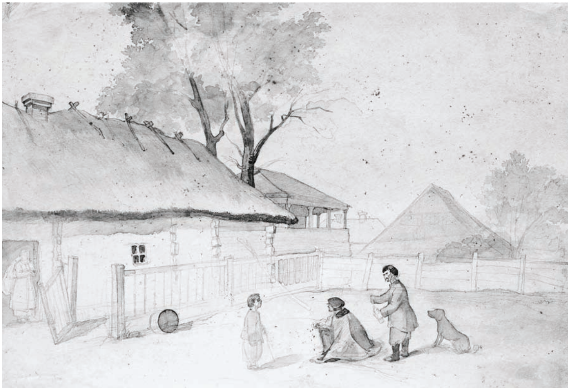
Селянське подвір'я. Яготин. Весна 1845 р. Папір, сепія