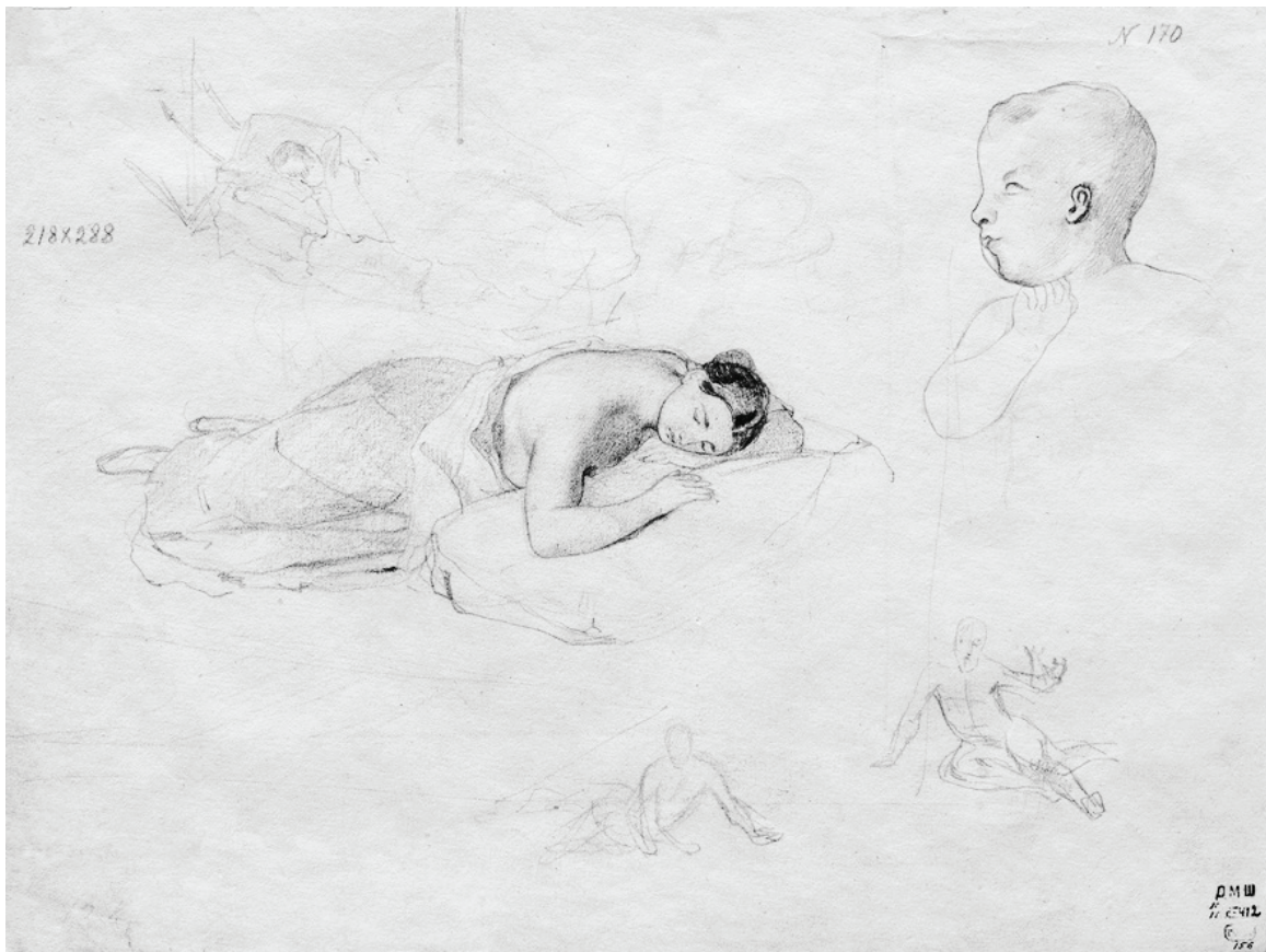
Жінка, що спить, та інші зарисовки. 1839–1840 рр. Папір, олівець