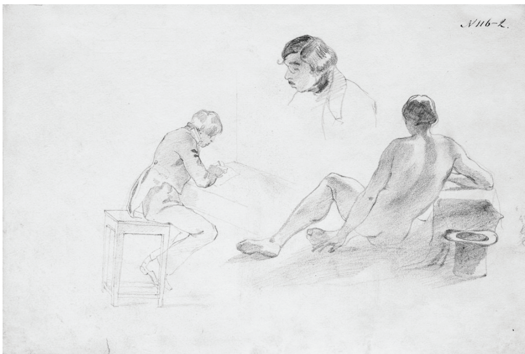
У натурному класі Академії мистецтв. 1839–1840 рр. Папір, олівець