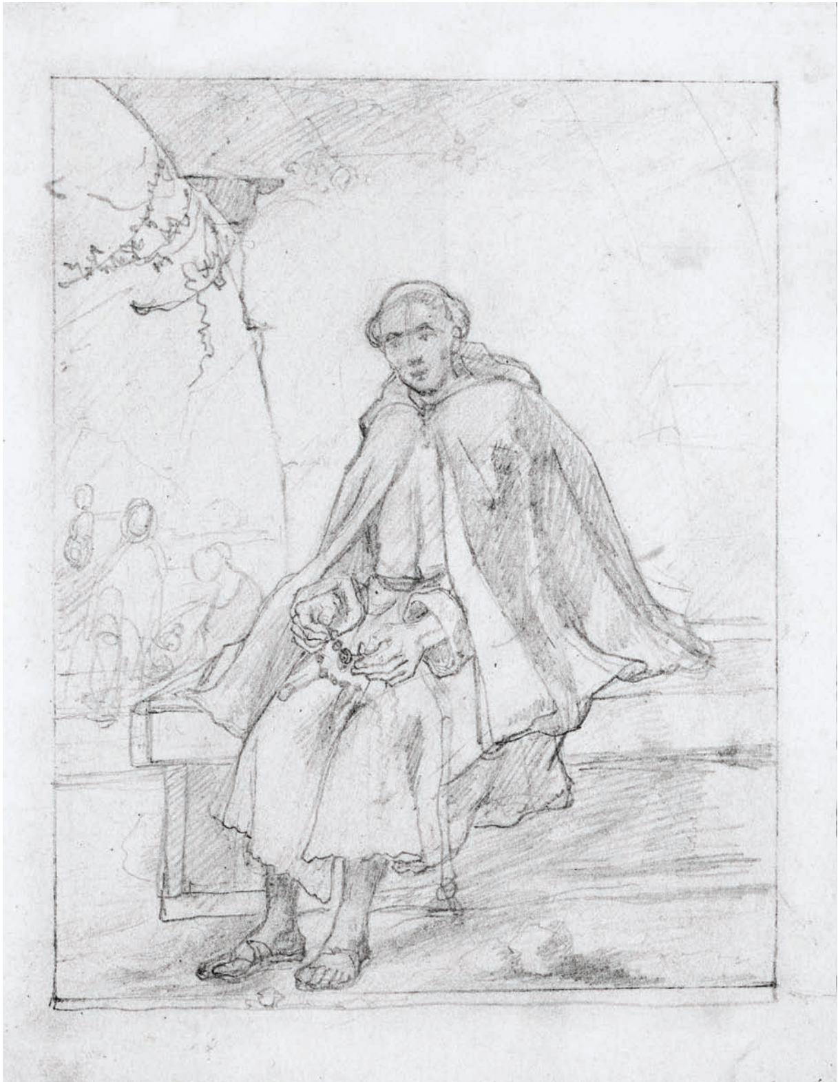
Католицький чернець (ескіз ілюстрації до твору М. І. Надеждіна «Сила волі») 30.IV.1841. Папір, олівець