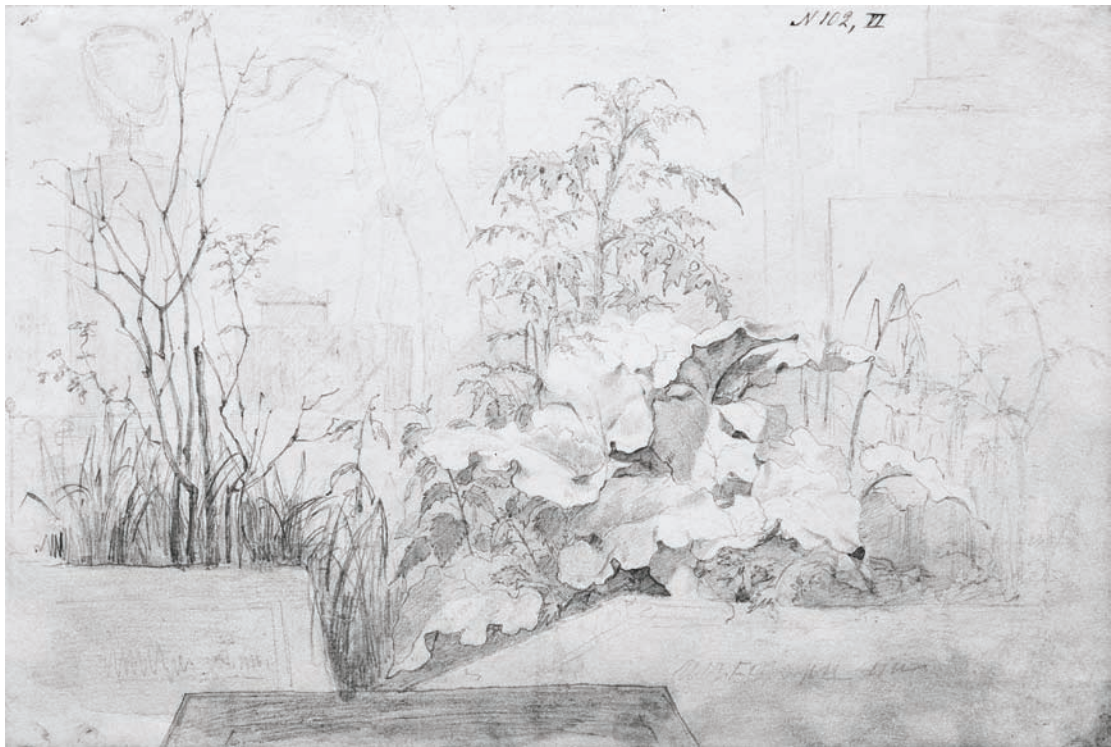
Куток Смоленського кладовища в Петербурзі. Літо 1840 р. Папір, олівець, сепія