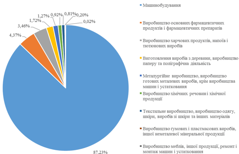
Рисунок 2 – Структура реалізованої інноваційної продукції підприємствами Харківської області у 2015 році за видами економічної діяльності