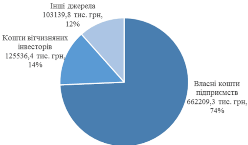
Рисунок 4 – Структура фінансування інноваційної діяльності промислових підприємств Харківської області за джерелами у 2017 році

Однак, за результатами досліджень, основним джерелом фінансування інновацій є власні кошти підприємств (рис. 4).