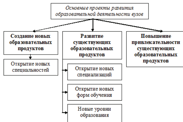
Рис. 5. Основные проекты развития образовательной деятельности вузов

Отметим, что проекты, направленные на повышение привлекательности существующих образовательных продуктов вузов весьма многообразны — это и повышение качества обучения, и трудоустройство лучших выпускников, повышение практической направленности обучения, пересмотр и адаптация к современным требованиям учебных планов и программ.