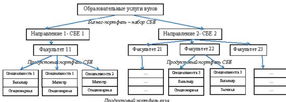
Рис. 3. Бизнес-портфель и продуктовый портфель вуза

Отметим, что по аналогии с предприятиями других сфер деятельности «продуктовый портфель» для вузов — это набор специальностей. Более того, классическое понятие стратегического менеджмента «СБЕ — стратегическая бизнес-единица» также может быть применимо к вузам, что влечет за собой применимость к деятельности вузов термина «бизнес-портфель» (рис. 3). Стратегическая бизнес-единица вуза — это либо