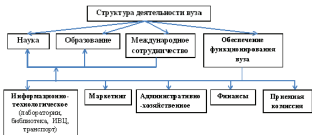
Рис. 1. Структура деятельности вуза

В [5] были определены следующим образом основные направления деятельности вузов (рис. 1).