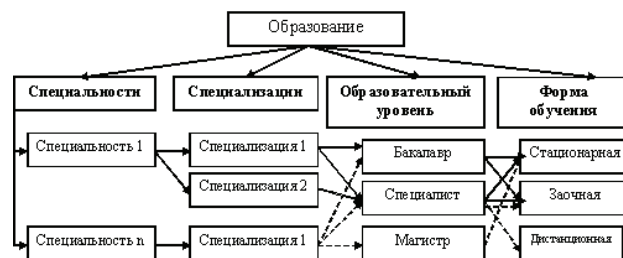
Рис. 2. Структура направления деятельности вузов «образование»

Таким образом, стратегия развития вуза представляет собой целую систему необходимых стратегических преобразований, которые на практике реализовываются посредством проектов, программ и портфелей проектов. В центре внимания данной работы — проекты в рамках стратегического развития направления деятельности вузов «образование». Для определения основных видов проектов (с точки зрения содержания) по данному направлению, идентифицируем его структуру. На рис. 2 представлена декомпозиция направления деятельности «образование» с примером. Каждое сочетание «специальность — специализация — образовательный уровень — форма обучения» является образовательным продуктом вузов.