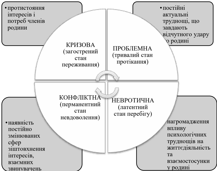
Рис. 2. Типи родин в залежності від стилю конфліктності

конфлікти змінюються, проте ситуація конфлікту постійна. Як наслідок, можемо говорити про відповідний конфліктний тип особистості одного або обох із подружжя, що вимагає відповідного консультативного чи корекційного втручання (Ейдемиллер, 1996).