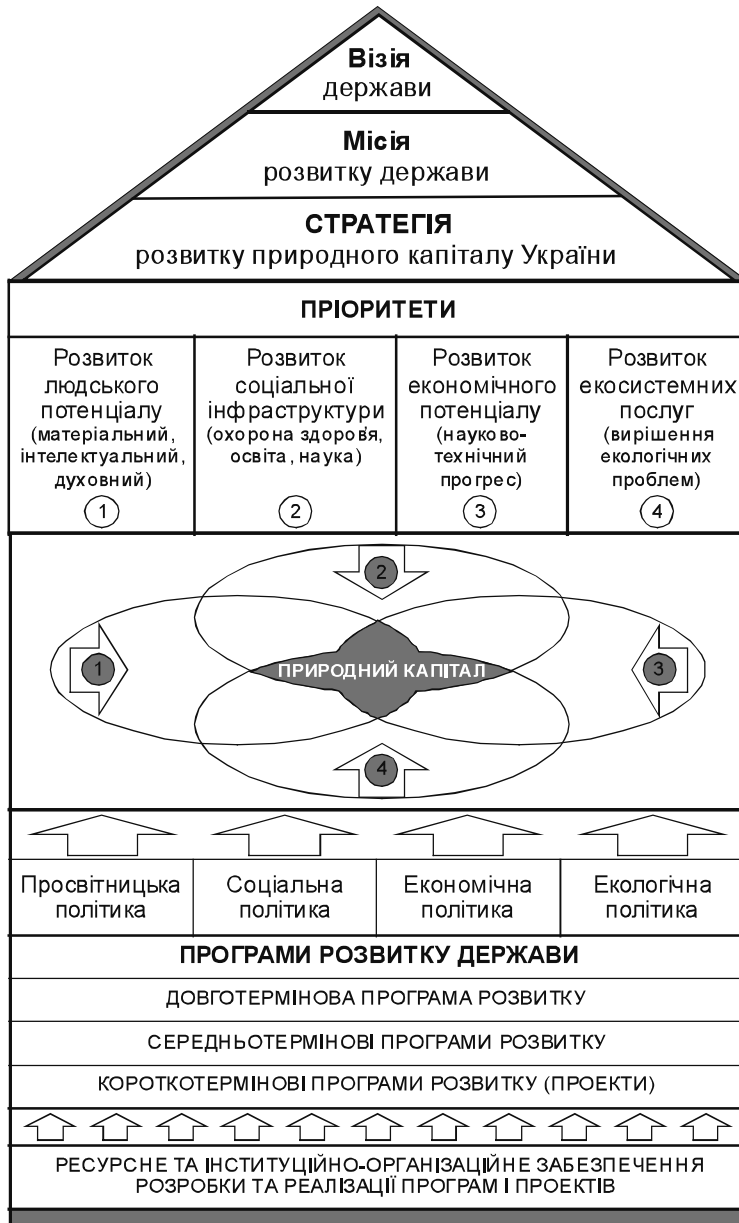
Рис.1. Модель стратегії розвитку природного капіталу України

У класичному вигляді узагальнений процес стратегічного планування передбачає виділення трьох стадій: