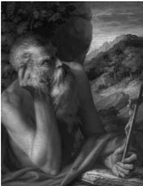
Рис. 3. Франческо Парміджаніно «Святий Ієронім» (підробка)

Як приклад правосуб'єктності розглянемо можливість здійснення продажу арт-фондом Ендрю Веббера картини Пабло Пікассо «Портрет Анхеля Фернандеса де Сото» (рис. 4). У 2006 році фонд Веббера прагнув продати