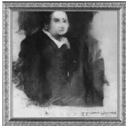
Рис. 7. Портрет Едмонда Беламі, створений нейромережею GAN, 2018 рік