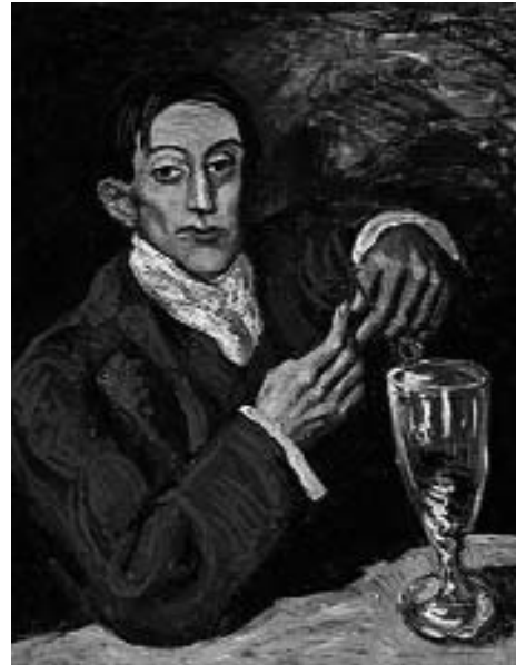
Рис. 4. Пабло Пікассо «Портрет Анхеля Фернандеса де Сото», 1903 рік