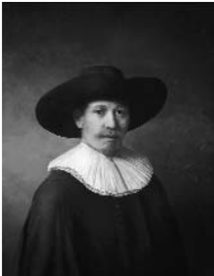
Рис. 6. Портрет «Новий Рембрандт», створений нейромережею

Суб'єкти правовідносин у процесі виконання ними вимог, передбачених нормами об'єктивного права, і набуття визначеного комплексу прав та обов'язків є контрагентами стосовно один одного. Наприклад, покупець — продавець, замовник — виконавець. При цьому, суб'єктивне право завжди належить уповноваженій особі, яка має матеріальний, духовний чи інший інтерес. У можливості задоволення цього інтересу і полягає соціальна цінність суб'єктивного