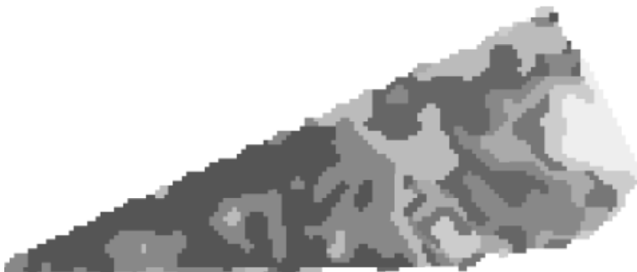
Рис. 2. Електронна карта контурів ґрунтів, створена за даними космічного сканування

Для підсумкового висновку про достатність та доцільність такої деталізації проведено узагальнення даних польового обстеження ґрунтів полігону. Вибірка поєднала дані щодо чорноземів зі вмістом гумусу 0,8–