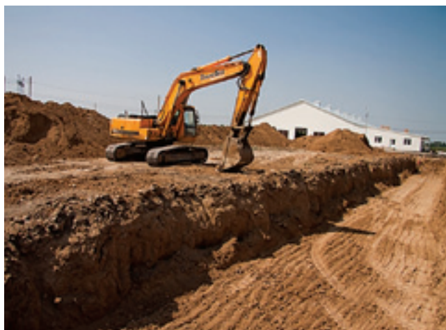
Строительство в полном разгаре

Вся территория фермы застраивается очень компактно и напоминает европейскую модель по наполнению. На 90% все сооружения уже готовы. Осталось только завезти скот и привезти рабочих. О том, что будет тут через 1,5-2 месяца директор фермы рассказал более детально.