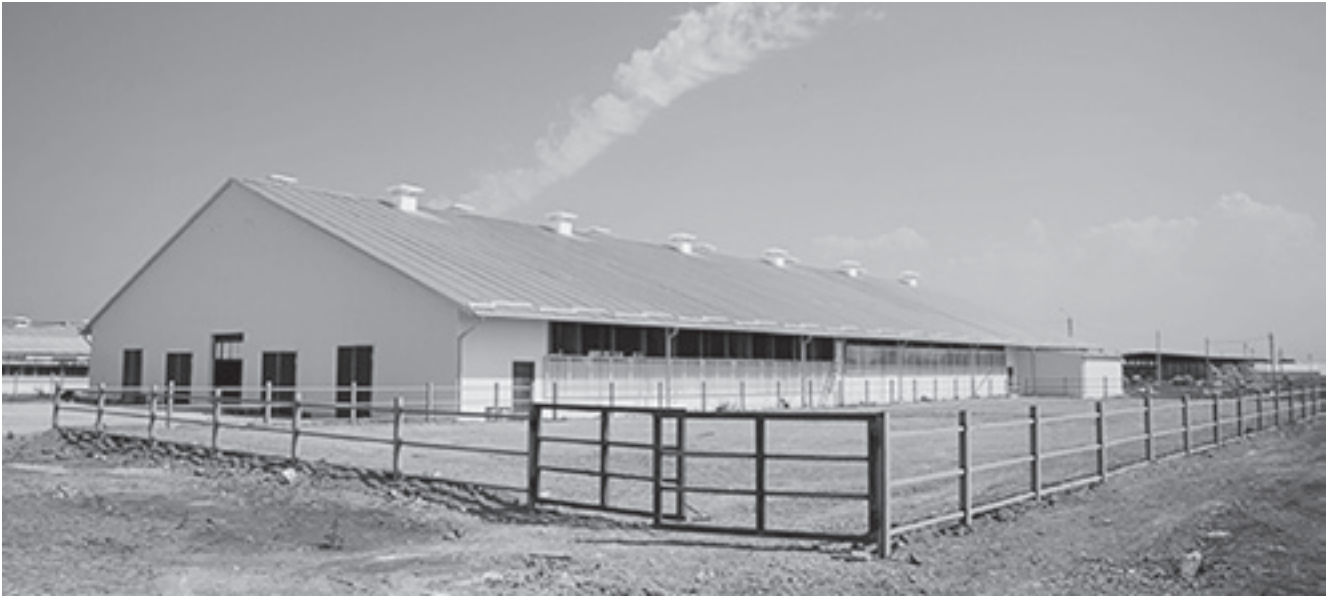
Ферма «Кронос-Дон» (Донецкая область)