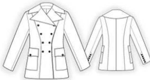
Рис. 3. Зовнішній вигляд зразка №3

Зразок №3 – напівпальто жіноче демисезонне напівприлеглого силуету сірого кольору, довжиною 70 см., модель 2839, вартість виробу – 500 грн.