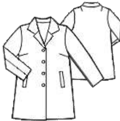
Рис. 2. Зовнішній вигляд зразка №2

Пілочки оформлено двома нагрудними виточками, які вдало виділяють лінію грудей, та двома прорізними кишнями з листочками, що мають вертикальне положення для зручності. Застібка однобортна, здійснюється на 4 петлі та 4 гудзики в тон тканини. Підборт суцільнокрояний з пілочкою, проклеєний дублериним для жорсткості. Комір звичайний відкладний, жакетного типу, з заглибленою лінією горловини, аж до лінії грудей. На спинці виконано дві плечові виточки, вони служать як для оздоблення так і для кращого прилягання виробу по фігурі. Напівпальто має класичний двошовний рукав. Напівпальто виготовлене акуратно, шви рівні, кріплення фурнітури симетричне відносно виробу.