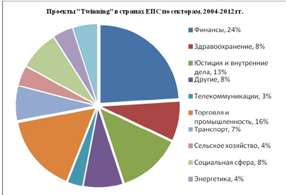
Рис. 1. Проекты «Twinning» в странах ЕПС по секторам, 2004-2012 гг. Составлено автором на основе [1].