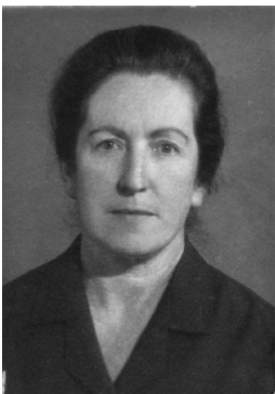
Іл. 1. Наталія Чмутіна. Фото з особистого листа члена спілки архітекторів СРСР 1971 р. [8]

Аналіз останніх досліджень та публікацій. Творчий шлях видатного архітектора України Наталії Борисівни Чмутіної висвітлено у книзі