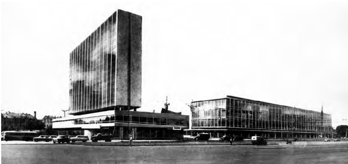
Іл. 5. Готель «Либідь», автор: архіт. Н. Б. Чмутіна, співавтори: архіт. О. К. Стукалов, Ю. А. Чеканюк, А. М. Аніщенко, фотоколаж 1965 р. [4, с. 163]

Перші згадки про участь жінок в архітектурній діяльності належать фактично до початку ХІХ століття. Питання нерівності жінок-архі-