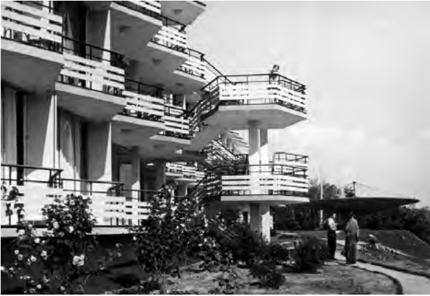
Іл. 3. Готель літнього типу «Тарасова гора». Балкони та сходи, фото 1962 р. [4, с. 141]