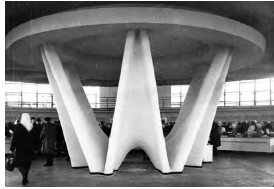
Іл. 4. Експериментальний критий ринок на 310 торговельних місць із великопрогонним вантовим покриттям, Черкаси, архіт. Н. Б. Чмутіна, А. М. Аніщенко, 1966 р. Центральна залізобетонна опора вантової покрівлі [4, с. 150]

Елегантна, витончена модерна форма опори більше нагадує сучасну скульптуру (іл. 4). Дотепер ринок функціонує за призначенням, лише центральна опора і фасади перекриті сучасними МАФами, спотворюючи первинний задум.