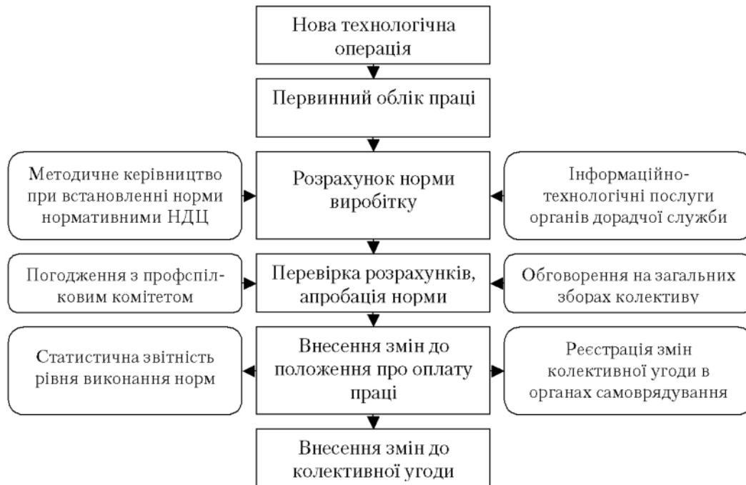
Рис. 2. Схема впровадження норм і нормативів у виробництво з урахуванням дії інституціонального середовища

2. Для успішного функціонування системи нормування живої й уречевленої праці у рослинництві слід відновити службу нормування праці сільськогосподарських підприємств, організувати підготовку відповідних кадрів вищої кваліфікації, забезпечити виробництво фахівцями середньої ланки, а також принципово змінити ставлення до статистичної звітності з праці. Це можливо лише за умови взаємодії наукових установ, вищих аграрних навчальних закладів усіх рівнів акредитації, дорадчих служб, громадських організацій тощо. Доцільним