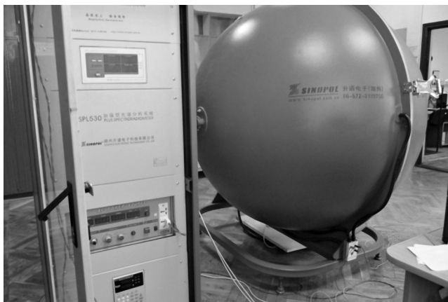
Рис. 1. Вимірювальний комплекс SPL 2000

СРП джерел світла може мати інший вплив на сприйняття яскравості середовища, таке як світність, дискомфортні відблиски та циркадні ритми. Такі ефекти можуть відбуватися як на фотопічних, так і на мезопічних рівнях, тому світлотехніки повинні брати їх до уваги при проектуванні світлових установок.