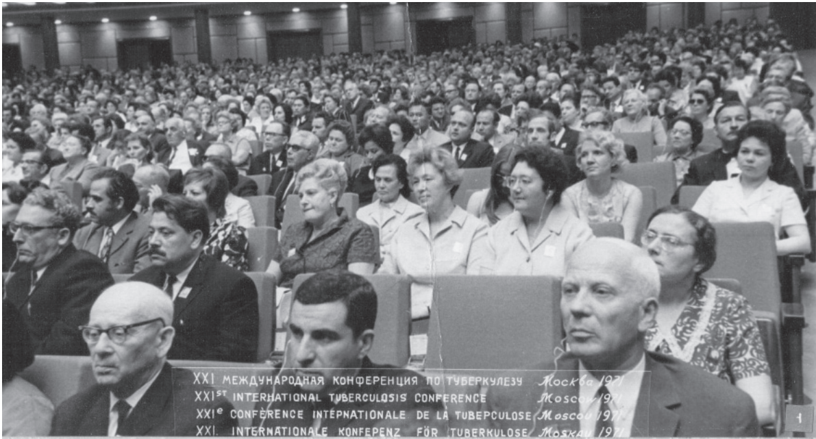
XXI міжнародна конференція по туберкульозу в Москві, 1971 рік.

Україна оцінила внесок професора Г. Г. Горovenка у вітчизняну науку і практику. В 1997 році він був удостоєний (посмертно) звання лауреата Державної премії