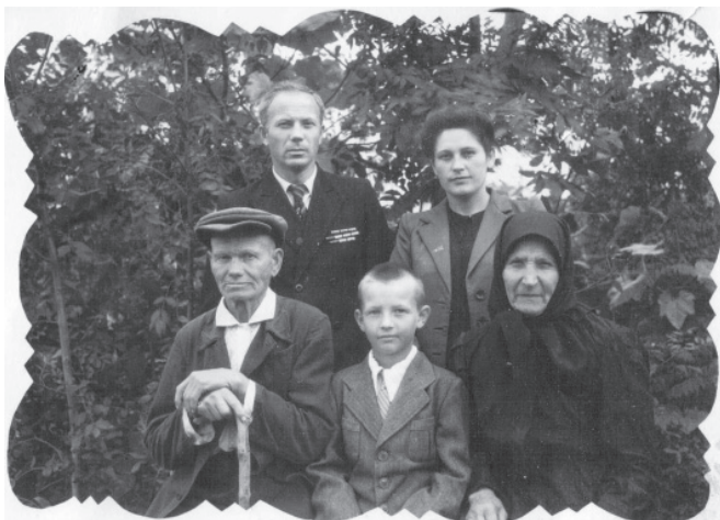
З батьками, дружиною та сином в с. Піщаному.