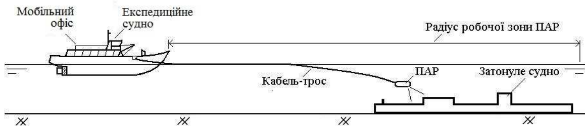
Рисунок 4 – Схема застосування ПАР «Інспектор» на малих глибинах