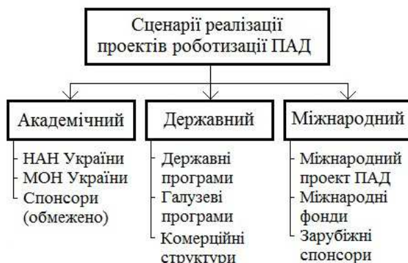
Рисунок 2 – Складові сценарного підходу до реалізації проєктів роботизації ПАД

Можлива реалізація сценарного підходу у проєктах роботизації ПАД показана на рис. 2.