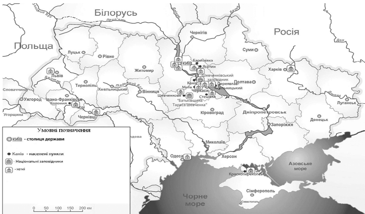
Рис. 3. Музеї Тараса Шевченка в Україні

Нижче наведено таблицю Шульте, адаптовану до малюнків, гравюр і картин Тараса Шевченка (рис. 4).