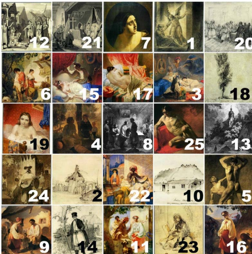
Рис. 4. Картини, малюнки, гравюри з експозиції Національного музею Тараса Шевченка (Київ)

Нижче наведено таблицю Шульте, адаптовану до малюнків, гравюр і картин Тараса Шевченка (рис. 4).