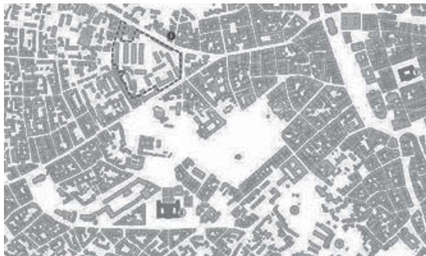
Рис. 4. Ситуаційна схема ділянки опрацювання воркшопу New urban density Lab Lviv 2017 [18]

У межах воркшопу New urban density Lab Lviv 2017 студентами Віденського технічного університету та Національного університету “Львівська політехніка” розроблено низку концептуальних проектів інтенсифікації території в історичному ареалі Львова – військової частини (між вул. Шевченка та Городоцькою).