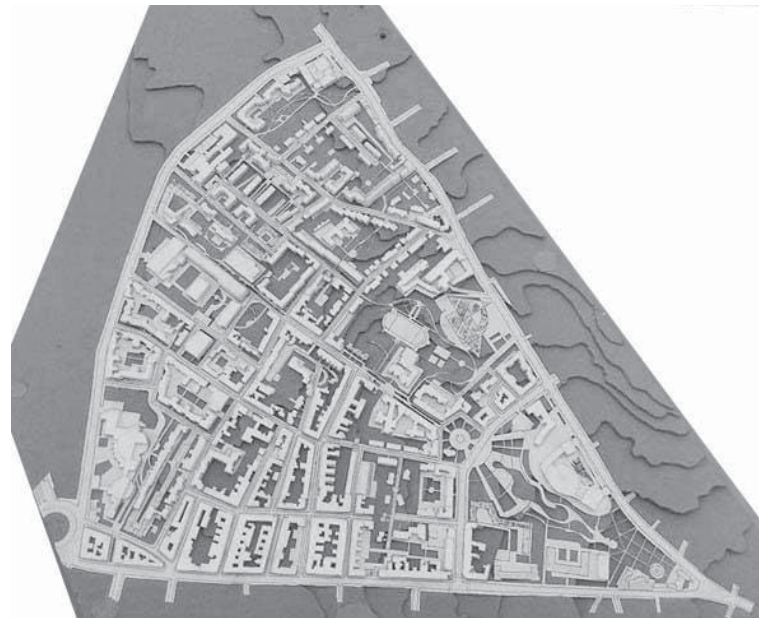
Рис. 2. Макет території військової частини (між вул. Шевченка та Городоцькою у м. Львові) на основі плану, виконаного Т. М. Мазур [15]

Метою реалізації детального плану є впорядкування функціонально-планувального каркасу території, що полягає у реструктуризації дисонуючих підприємств, які перебувають в оточенні житлової забудови, перепрофілюванні виробничих територій з влаштуванням на місці спеціальних, виробничих та комунально-складських зон – житлових, громадських, навчальних, озелених територій рекреаційної, транспортної та комунально-складських зон з переліком переважаючих, допустимих та супутніх видів забудови та іншого використання земельних ділянок [17].